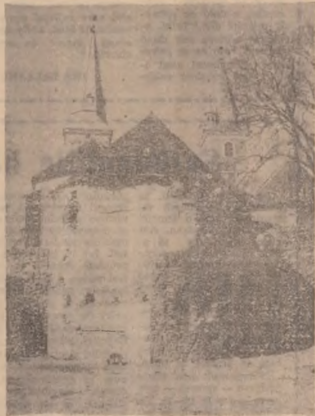
ORAȘTIE — CETATEA