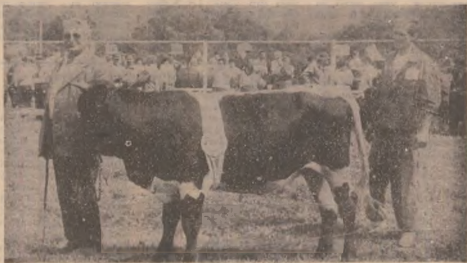
Cu o asemenea vacă în bățatură, chiar că iese sărăcia din casă.

clădire și pe incinta acesteia, s-a accentuat cu trecerea timpului. Singurul lucru care a rămas oarecum neschimbat și mai constituie un indiciu că aici ar exista, totuși, un cămin cultural, este doar firma cu inscripția respectivă. Nu se găsește oare nimeni dispus să schimbe o asemenea peisaj dezagreabil?