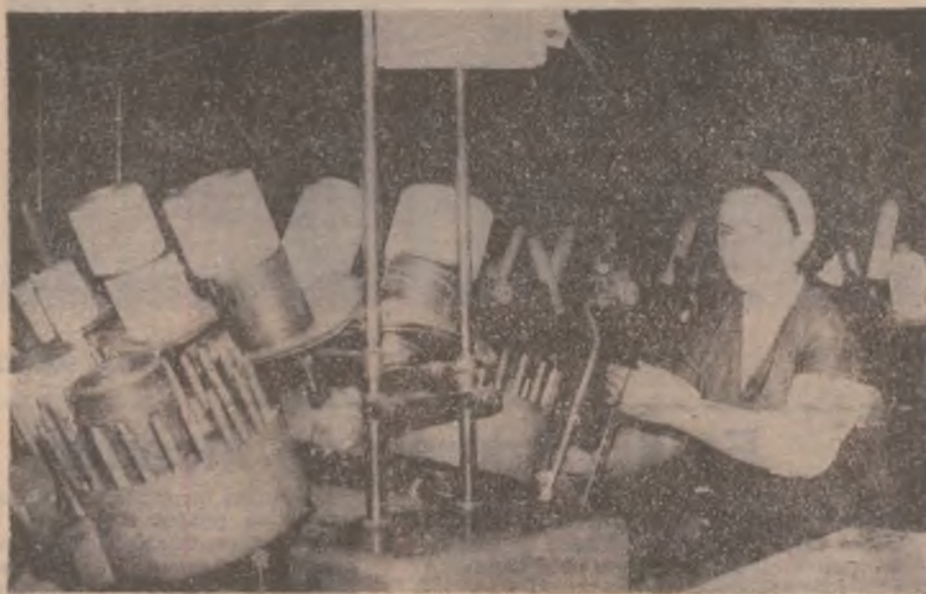
MATEX S.A. DEVA. Se lucrează cu spor la mașina pentru pregătirea canelor ce se folosesc la țesătură.