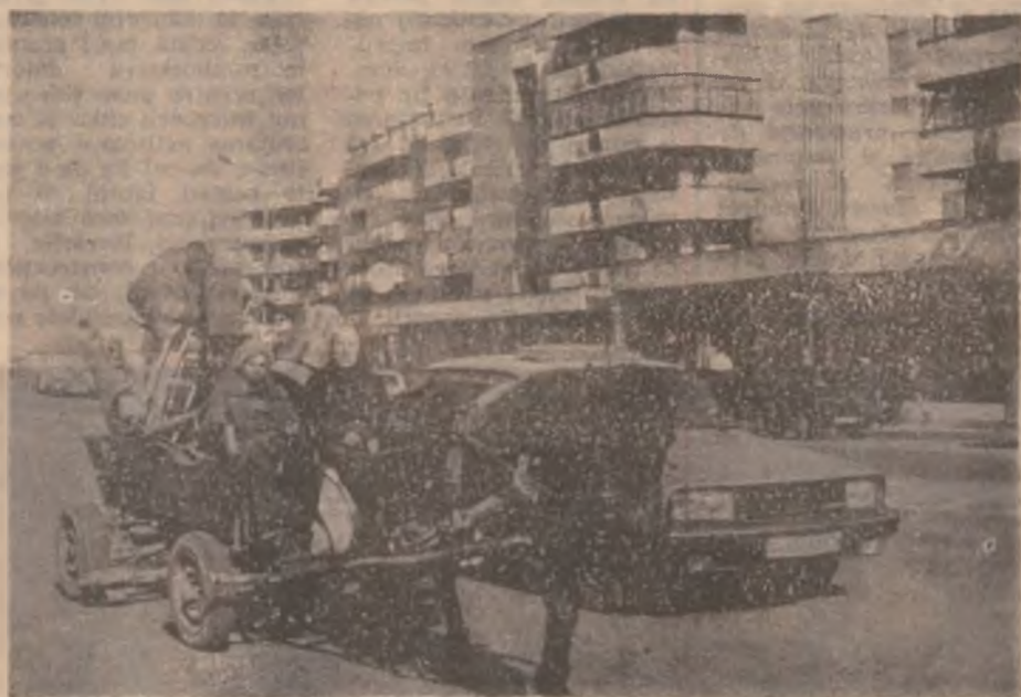
Intrecerea... cailor putere.

Dacă, pe de o parte, a pare ca o notă foarte bună faptul că (așa cum am văzut în multe gospodării din satele comunei Băchivova) există mari cantități de fan adunat (o parte fiind și acum în clăi pe camp, chiar și de peste ani, acest lucru demostrează că gospodării nu lasă furajele nerecoltate să se risipească), pe de altă parte se vede că la diminuarea efectivelor de animale, o asemenea situație, în care fanul a rămas pe suprafețe însemnate necosite, s-a semnalat mai ales în zona Brad, unde sunt abandonate și unele terenuri arabile. Desigur că o bună valorificare a resurselor furajere din fiecare zonă a județului cere și o corelație mai bună a efectivelor de animale cu posibilitățile de producere și de utilizare a nutrețurilor, chiar dacă este vorba despre fanul natural. (N.T.)