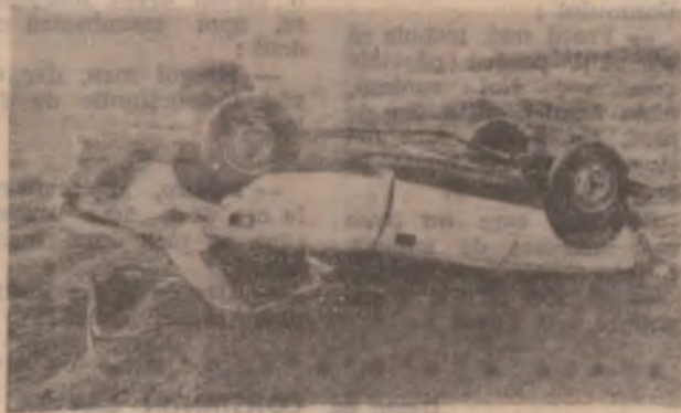
Autoturismul Peugeot, fotografiat după accident. Cei patru tineri care s-au răsturnat cu mașina pot spune că au avut noroc.

NOTĂ: Informații despre locurile de muncă vacante comunicate de către Oficiul de Forțe de Muncă și Șomaj Hunedoara-Deva puteți primi de la biroul Medierea Muncii, Centrul de Informare și Documentare, Clubul Șomerilor Deva precum și la birourile de Forțe de Muncă și Șomaj din Hunedoara, Călan, Orăștie, Brad, Simeria, Hașeg, Petroșani, Lupeni, Vulcan, în zilele de luni, marți, miercuri, joi, între orele 9—12.