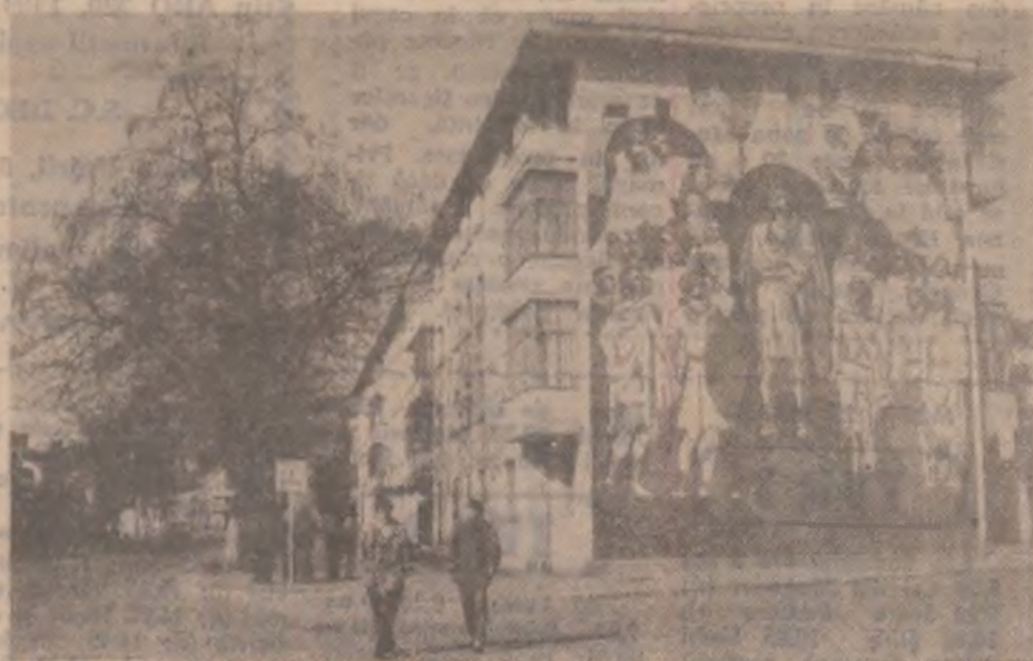
Oraștic în prag de primăvară.

Filiala Deva a Uniunii Veteranilor de Război și a Urmașilor Veteranilor face cunoscut tuturor membrilor UVRUV că aparțin de Filiala județului Hunedoara, că în data de 28 martie a.c., ora 10, se ține adunarea generală în sala de ședințe a Primăriei Municipiului Deva. Din partea conducerii Uniunii Veteranilor participă președintele acestui for, Ștefan Cucu. (M.B.)