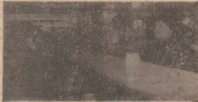
Efectul austerității din perioada tranziției se resimte acum și pe tarabele din piață.

În finalul discuției, dl Iuga ne-a rugat să transmitem anticipat mulțumirile sale dlui prefect pentru înțelegeri și posibilități primire în audiență, într-un timp cât mai scurt, pentru că treburi din județ și din țară, presante și diverse în această perioadă.