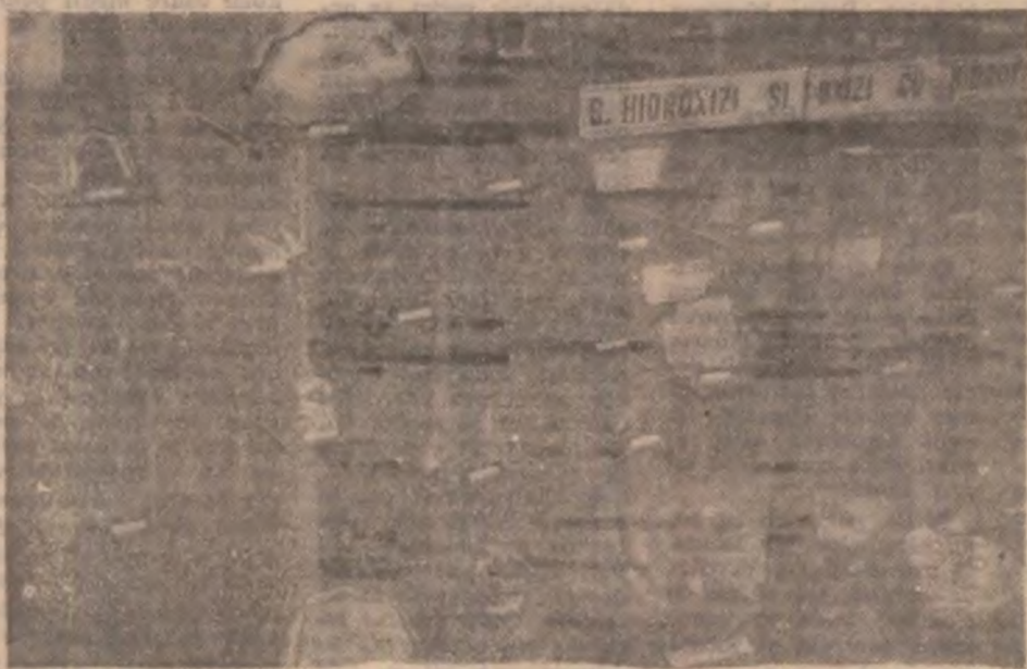
Muzeul aurului Brad.