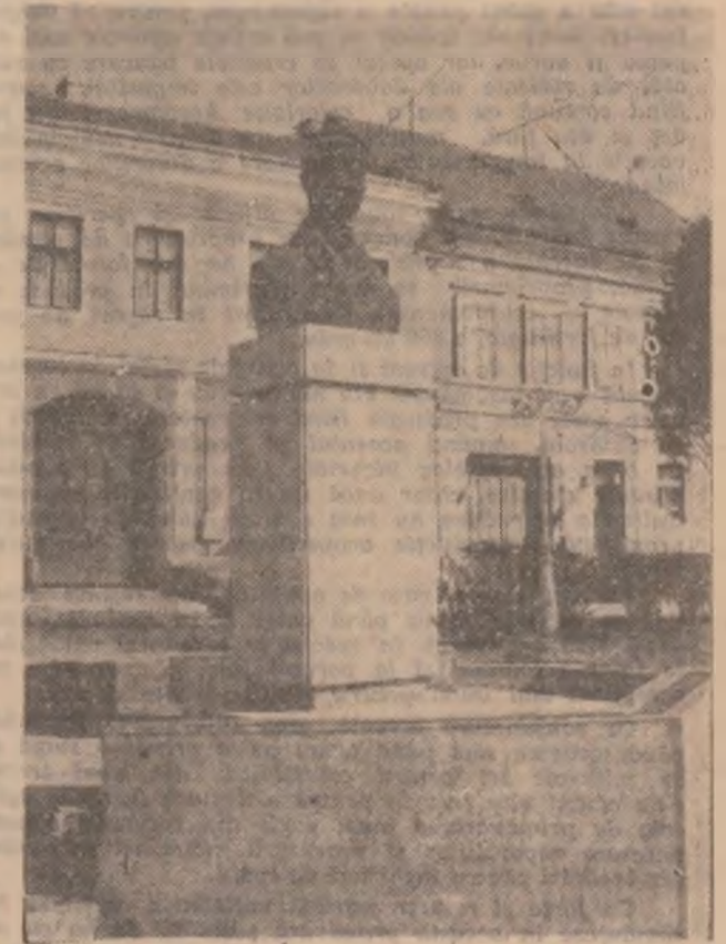
ORĂȘTIE — Statuia lui Aurel Vlaicu.