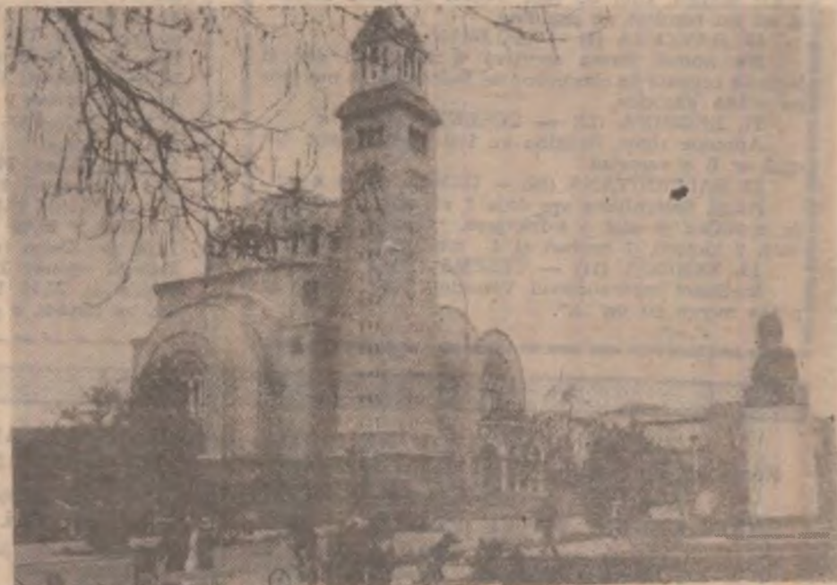
ORĂȘTIE — Catedrala ortodoxă

tări de la RAC Deva, cu datorii mai mari (EM Deva, Moldova Nouă și 3aia de Arieș) au beneficiat de prevederile hotărârii de guvern. Ieri, a avut loc la Prefectura Hunedoara o întâlnire între liderii minerilor și prefectul și subprefectul județului. Liderii sindicali au cerut reprezentanților guvernului în teritoriu să se implice în rezolvarea problemelor. (S.B.)