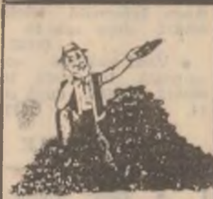
TRATAMENT CU BUTIZIN