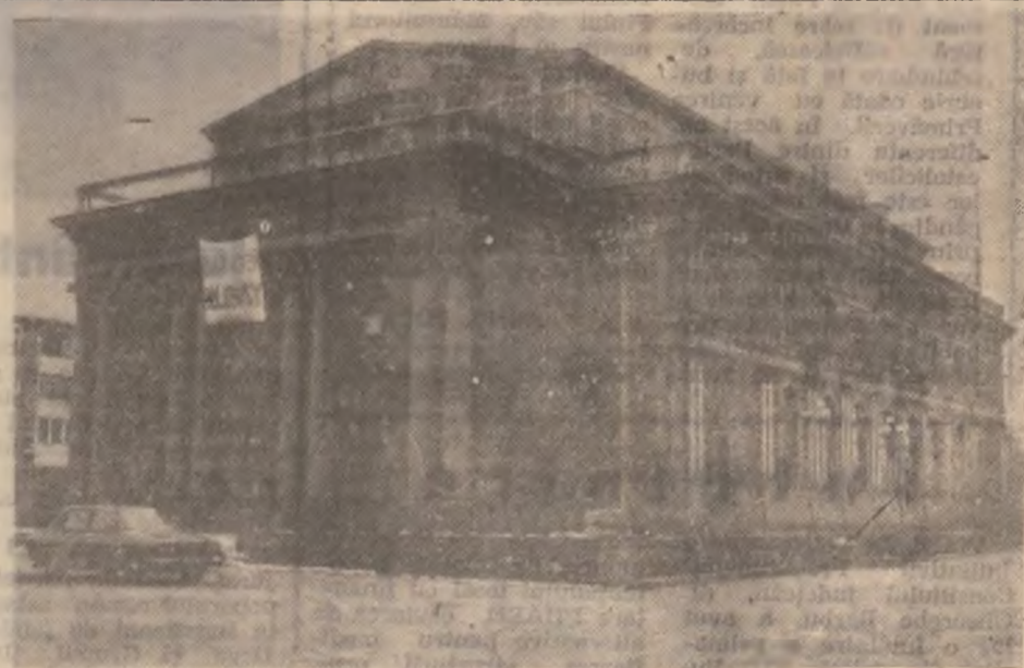
Municipiul Hunedoara — Casa de Cultură.

S-au mai dat răspunsuri referitoare la reconversia forței de muncă, la alte întrebări privind șomajul și protecția socială.