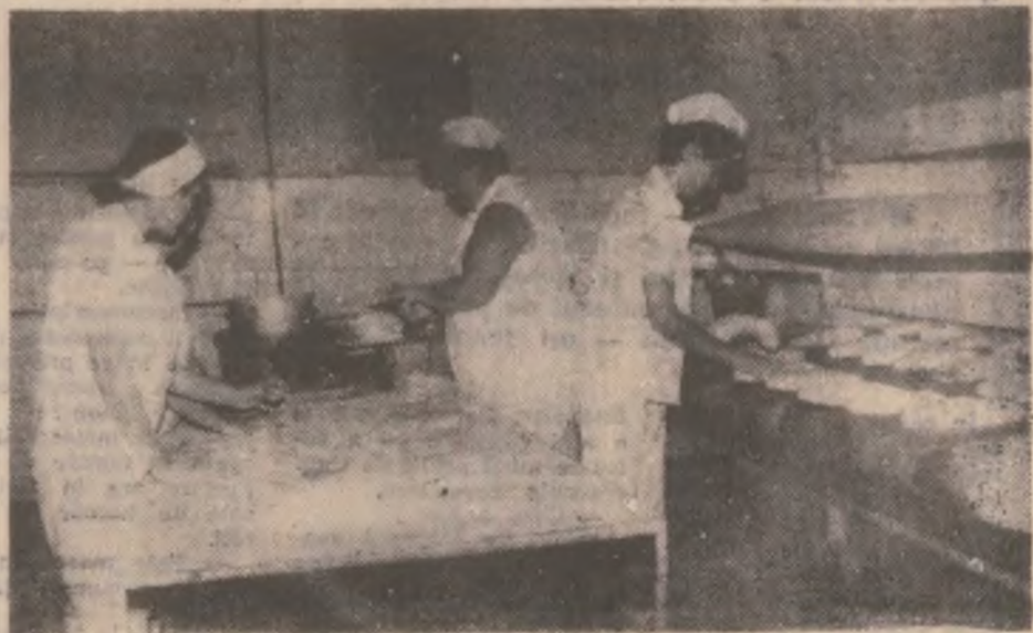
Prin mâinile acestor brutărițe trec zilnic 15 tone de aluat de pâine, cântărit și modelat sub forma diverselor sortimente, așteptate de cumpărătorii din Deva.

• Pentru bărbia dublă, vă sugerăm următorul exercițiu: stați cu spatele și capul drept, privind înainte. Impingeți în față bărbia, fără să deplasați