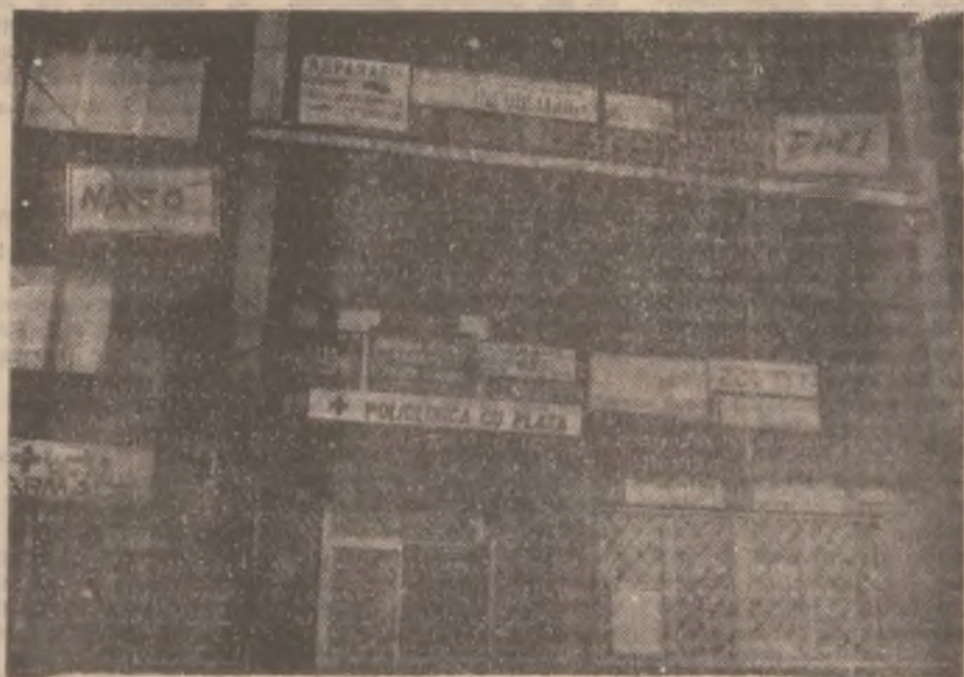
Dacă intri în această clădire nu se știe sigur unde ajungi!

ioane lei, reprezentând prime ce trebuiau plătite crescătorilor de vite. (S.B.)