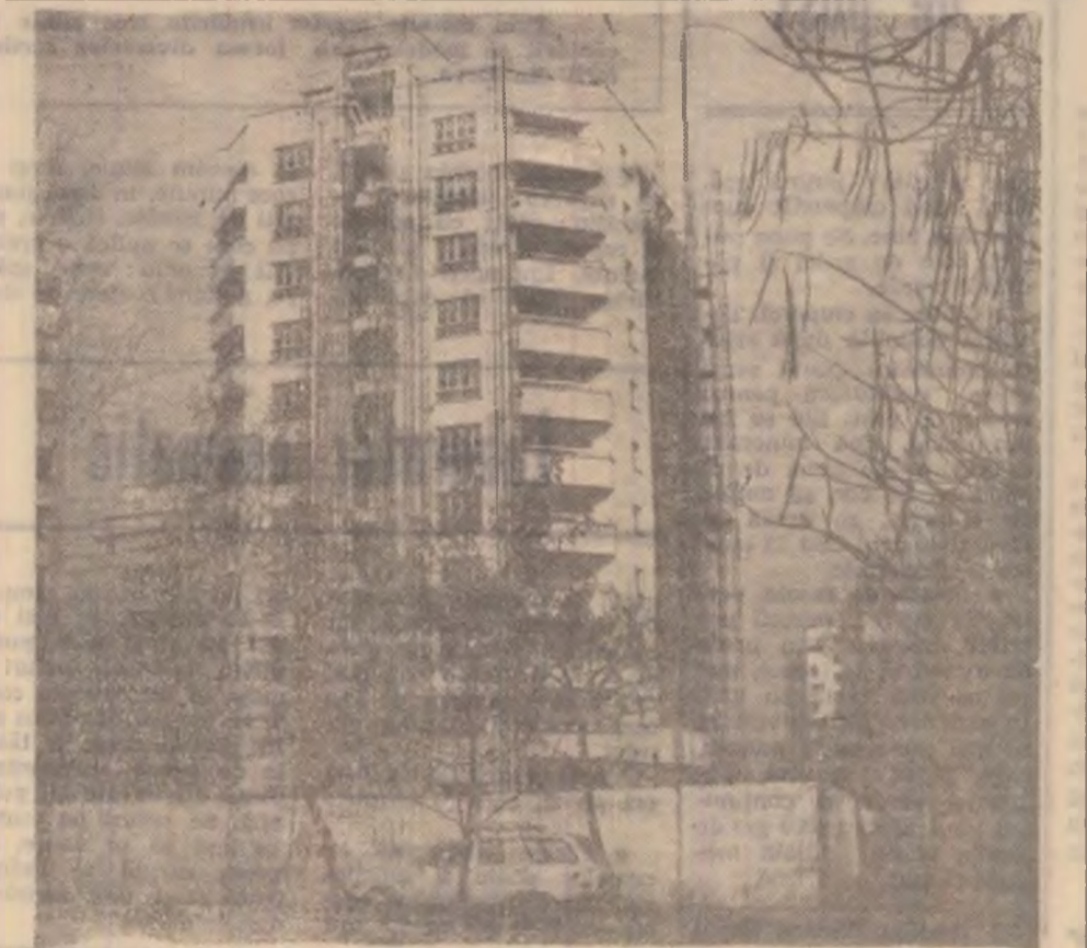
DEVA — zona Gării — se lucrează intens la finalizarea unui bloc cu zece etaje.