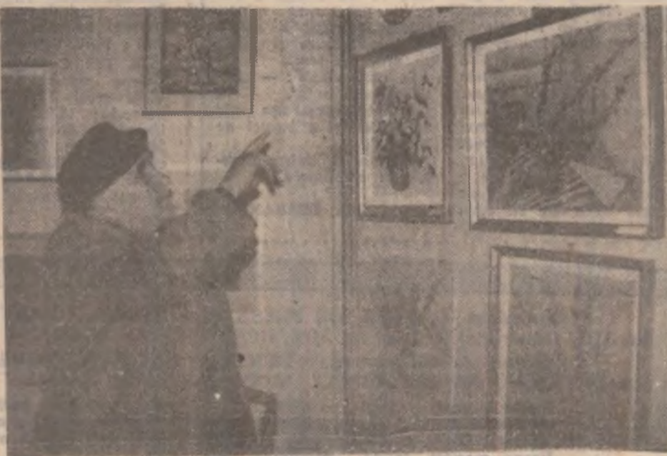
Aspect din expoziția „Fereastră senină în mijlocul suferinței”.