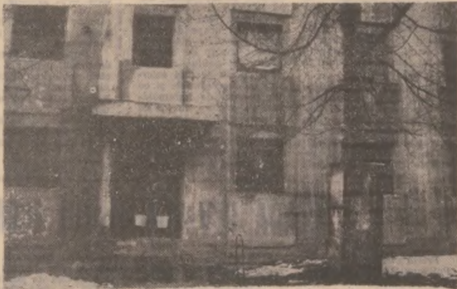
La unul dintre blocurile părăsite din Micro 7 — Hunedoara — un băiat duce mâncare la animalele ce sunt... crescute în bloc!