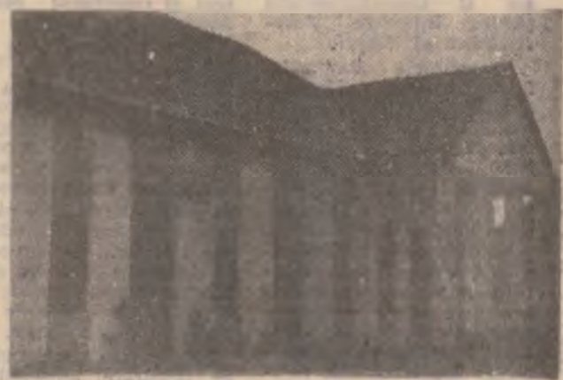
Frumosul cămin cultural din satul de reședință a comunei Unirea.