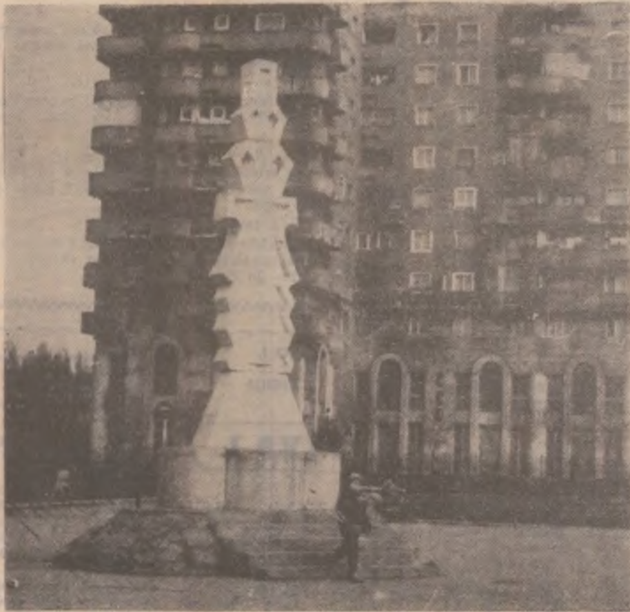
Hunedoara. Monumentul Revoluției Române