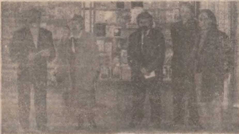
Aspecte din timpul desfășurării „Salonului editurilor hunedorene”.