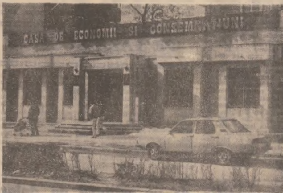
O casă spre care se îndreaptă speranțele noastre de a ține pasul cu inflația.

10,00 Obiectiv (r); 10,15 Repere culturale (r); 11,15 Documentar; 12,30 Film artistic (r); 14,00 Videotext; 19,00 Obiectiv; 19,15 Documentar; 20,00 Jurnal TVR; 21,00 Momente; 22,00 Film; 23,30 Obiectiv (r); 23,45 Videotext.