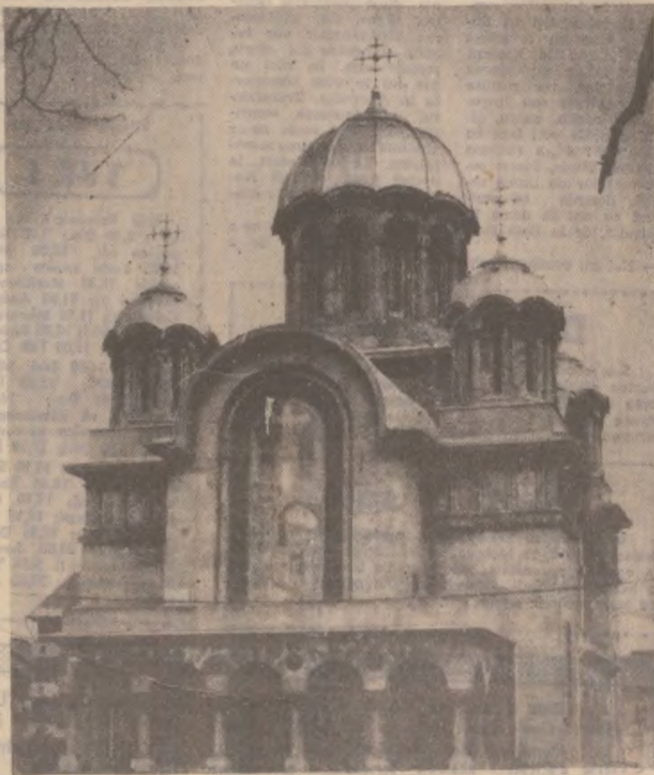
Catedrala din Hunedoara. Lucrările de construcție au început în anul 1339. Stilul este bizantin. Interiorul este lucrat în frescă de către pictorul Constantin Ștefan, din București. A fost zidită cu cărămidă de Sîntămbru, plăcată cu piatră adusă de la Banpotoc.

În cadrul preliminariilor C.M. de fotbal, la Vilnius, meciul din grupa a 8-a dintre Lituania — România s-a încheiat cu scorul de 1—0 în favoarea tricolorilor, prin golul înscris de Moldovan, min. 73. În partida Macedonia — Irlanda, au câștigat gazdele, cu 3—2. România se află pe primul loc și conduce detașat în grupă. Următorul meci al tricolorilor, la 30 aprilie, cu Irlanda la București. (S.C.)