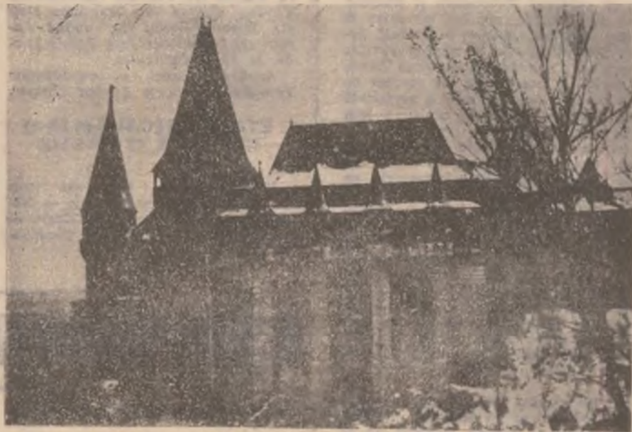
Castelul Corvineștilor. Vedere exterioară.