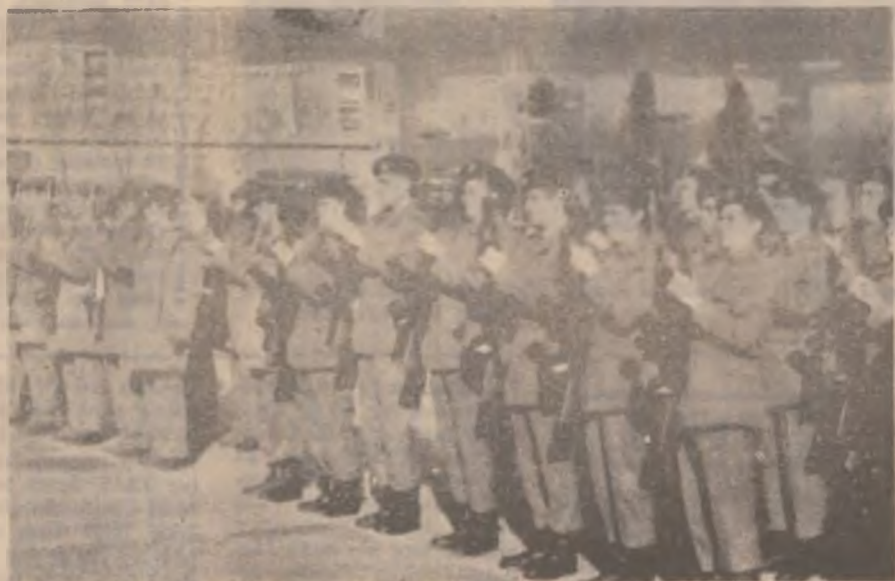
Aspect din timpul festivității de depunere a jurământului militar la U.M. Deva.