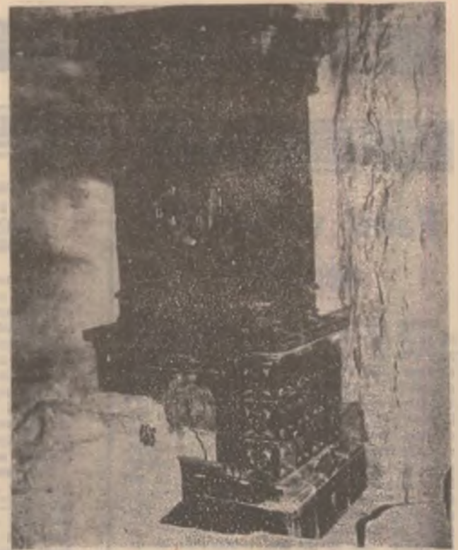
Sobă pentru încălzit, ce are inscripționat blazonul familiei Corvineștilor — corbul cu inelul în cioc.