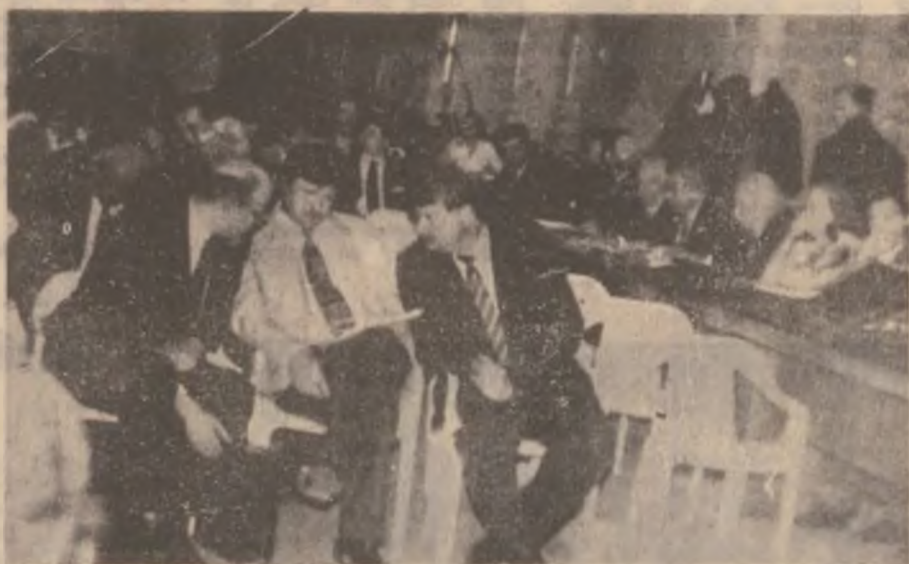
O parte a conducerii UDMR consultând unul din rapoartele prezentate CRU.

În paralel cu ședința Consiliului Reprezentanților Uniunii, sâmbătă au avut loc la Deva întâlnirile ale ministrului turismului cu directorii agențiilor economice de profil din județ, dezbateri cu reprezentanții Inspectoratului Școlar Județean și al altor instituții descentralizate ale statului.