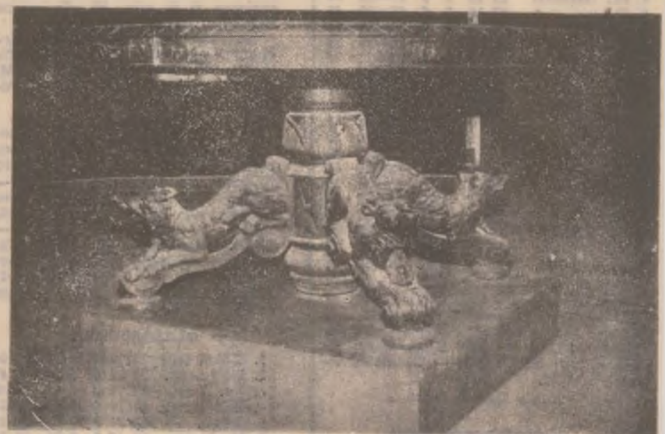
Mobilier de epocă aflat în castel.