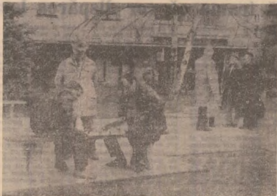
O partidă de șah și o discuție cu bunicii...