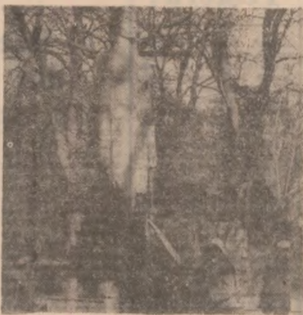
Dor de Eminescu !