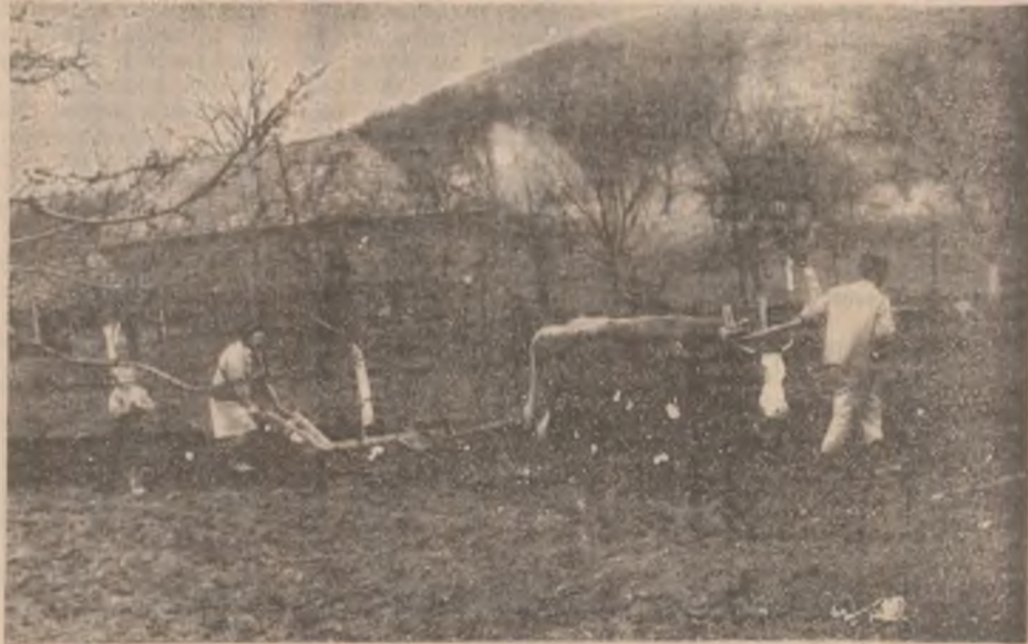
Așa se face astăzi agricultura la Roșcani

Ce mai fac acum „frații” din grota de la Roșcani? Se roagă în continuare, iar noi îi promitem cititorului un fotoreportaj mai larg despre acest fenomen.