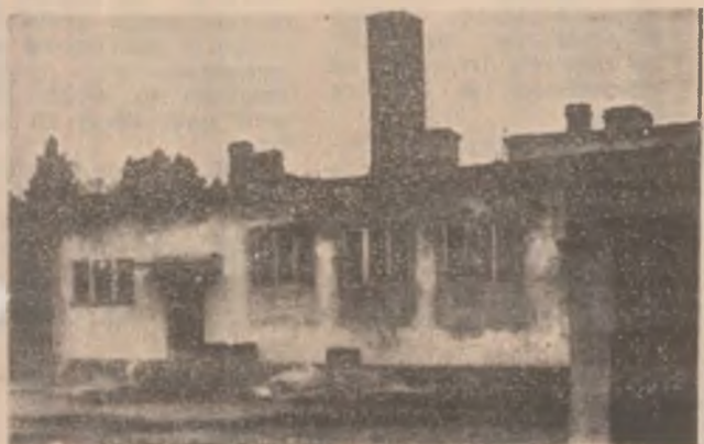
La Zam, în această clădire se plămăduiește și coace pâine. Vecinii spun că numai noaptea. Să aibă legătură cu starea de igienă a clădirii?