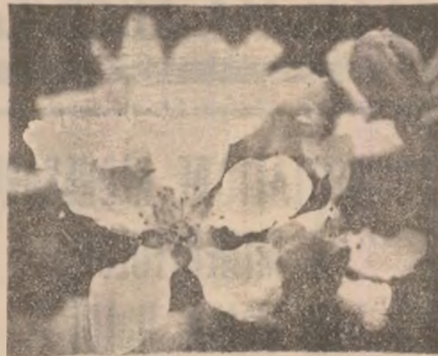
Infruntând frigul și ploaia ...