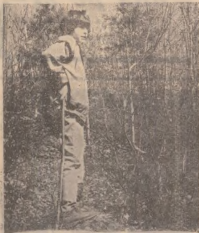
In Munții Zarandului

cesta putând costa în execuția gropilor pentru stâlpi și asigurarea materialului necesar confecționării acestora. Oricum, nu există motive pentru a abandona programul de electrificare, fiind în interesul județului nostru și al țării să fie păstrată populația satelelor montane izolate, astfel încât să fie valorificate resursele economice ale zonelor respective, inclusiv prin extinderea agriculturii.