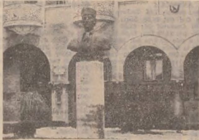
Bustul lui Avram Iancu, situat în fața Primăriei Consiliului municipal Hunedoara.

Primăria municipiului Hunedoara a demarat în aceste zile o vastă ope-