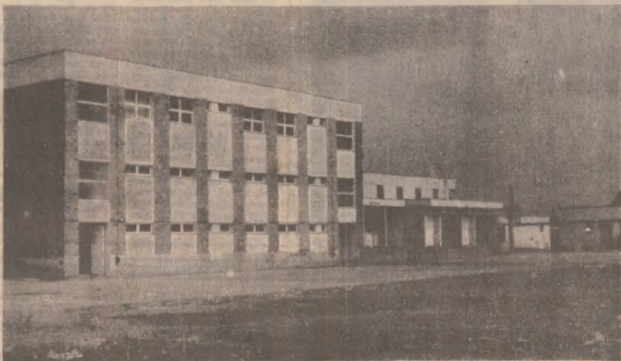
S.C. Decebal S.A. (industria cărnii) Deva. Noua fabrică de conserve a trecut cu bine probele tehnologice, inaugurarea oficială având loc azi, vineri, 18 aprilie a.c.