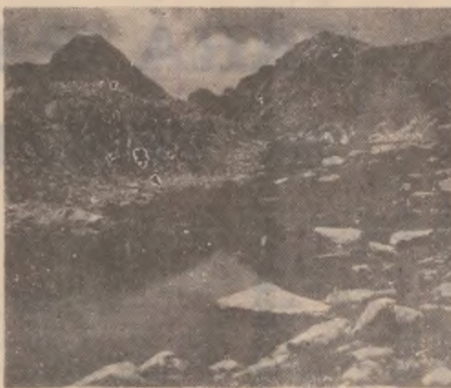
Retezat. Lacul Porții

Acum vreo 30 de ani, vara, mă deplasam pe poteca ce însoțea Râul Mare, de la Gura Anei spre Gura Zlata, împreună cu o familie din Bu-