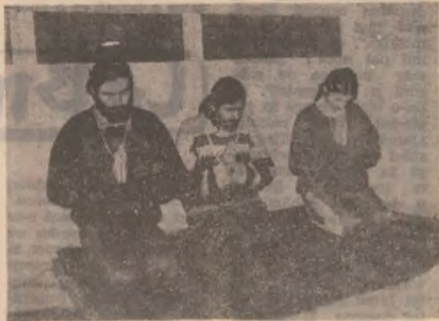
Frații se roagă pentru ei.