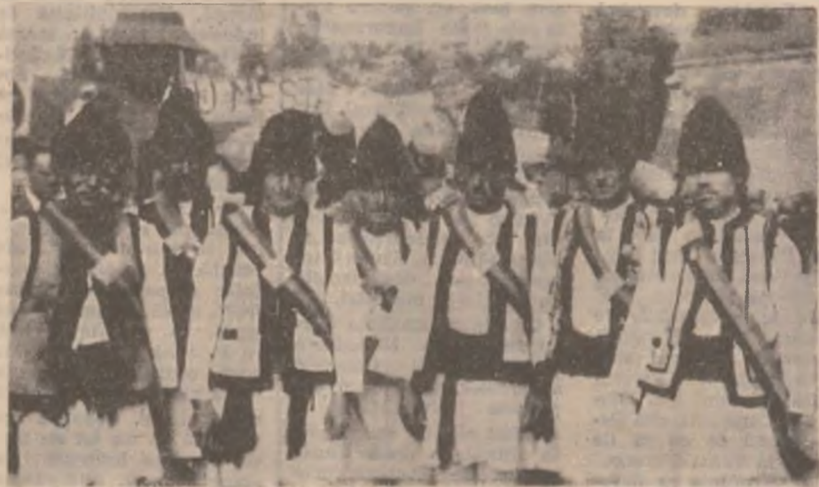
Poza reprezintă un grup din renumitul cor al plugarilor din Cosminul Bucovinei, care a luat premiul I la Concursul Internațional de la Praga, în 1933. Sunt urmașii arcașilor lui Ștefan cel Mare.