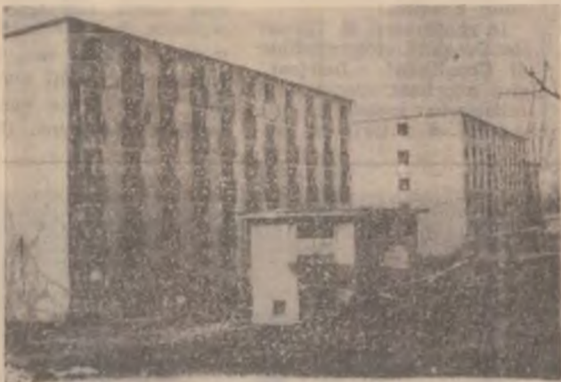
Hunedoara, cartierul Micro 7. Cele două blocuri din imagine au fost părăsite de către locatari. Vecinii din blocurile apropiate au amenajat la parter cuști unde cresc porci, găini, iepuri și câini. Aceste clădiri sinistre sunt adevărate focare de infecție pentru cetățeni mai ales că în vecinătate se află o școală.

Din cele declarate de primarul municipiului Hunedoara, dl. Remus Maris, primăria va desființa toate cocinile din focarul Valea Seacă, termenul limită fiind 30 aprilie. După această dată se va face o deratizare complexă a zonei.