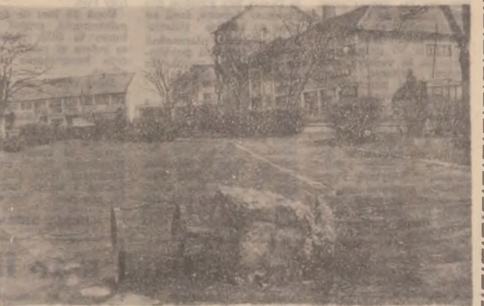
PARCUL DIN DOBRA Ceea ce se vede în imagine ar cam trebui să dea da gândit gospodarilor comunel.