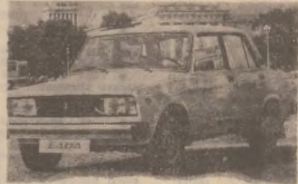
LADA VERA — 7 280 $ (la cursul zilei al dolarului)

Mașinile, la zero km. se livrează la Deva, cu promptitudine, în cel mult 15 zile de la data încheierii contractului.