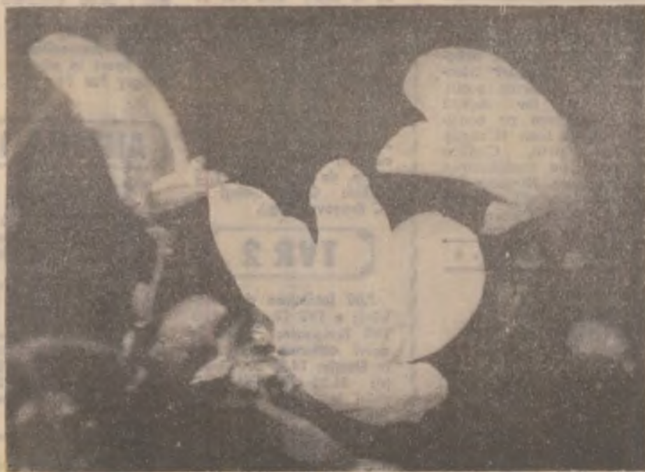
Floarea de magnolie.

Informații și înscrieri se pot lua de la Direcția Generală de Muncă și Protecție Socială Hunedoara — Deva, Serviciul calificării — recalificării șomerilor (O.P.)