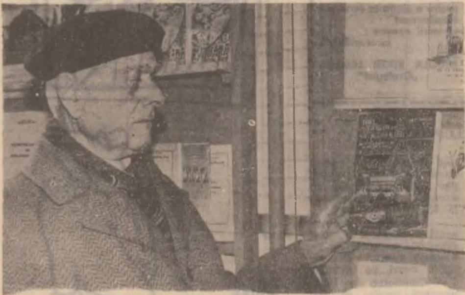
Cu gândul la sufletele și trupurile noastre.

Rubrică realizată cu sprijinul I.P.J. Hunedoara