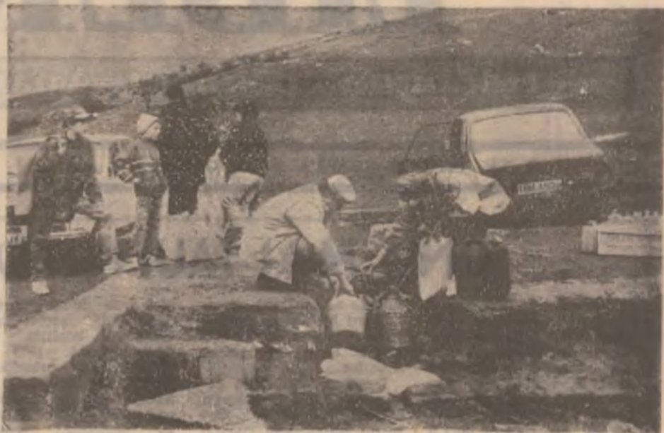
Chimindia (comuna Hărău). În apropierea localității, pe deal, există un izvor cu apă minerală folositoare la tratarea bolilor digestive. Imbuteliată în sticle bine capsate, apa își menține calitățile două până la trei luni. Numeroase persoane din județ și din alte județe limitrofe se aprovizionează de aici cu apă de băut.

Deși nu recunoaște fapta, probele administrate au determinat Parchetul de pe lângă Tribunalul Hunedoara să emită împotriva lui mandat de arestare preventivă. (I.C.)