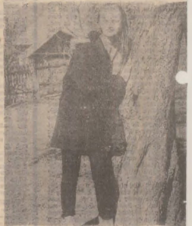
Totuși, a venit primăvara!