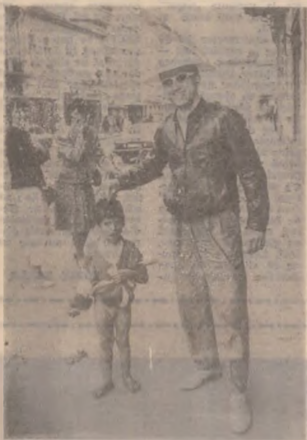
Imaginea nu are o legătură directă cu cei de la Lunca. Este pur și simplu o „amintire de vacanță”. Distractivă pentru unii, dar cât de dureroasă...