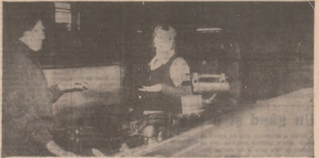
MATEX S.A., DEVA. Urzitor de mare productivitate

Surprinde o astfel de prevedere mai ales dacă se are în vedere că normele europene în materie stabilesc faptul că proporția soiei în preparate poate ajunge până la 15 la sută. Să fie ei oare mai cu moț decât noi și să dorească atât de mult să simtă și ei pe propria piele gustul salamului cu soia? Sau poate știu ei ce știu mai bine ca noi. (N.T.)