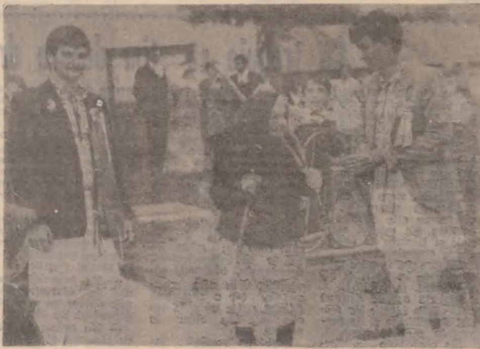
— Lasă-mă, maică! De nuntă îmi arde mie?