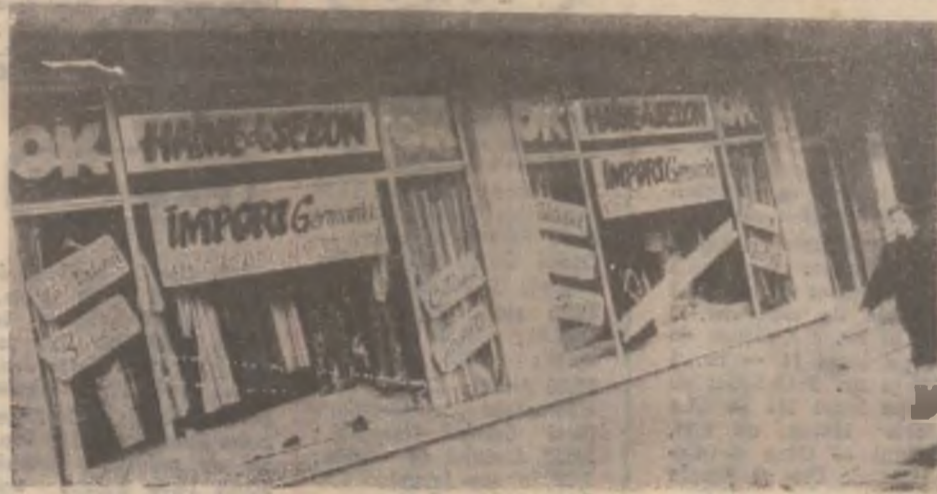
Această vitrină aparține unui magazin din centrul Devei, magazin aprovizionat cu haine vechi din Occident. Se spune că reclama este suflului comerțului, dar nici chiar așa... de „bun gust”!