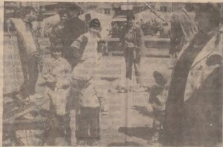
Aspecte din Piața centrală a Devei. Cei mari cântăresc marfa, alții o estimează din ochi, iar copiii, în inocența lor, își manifestă iubirea pentru mielușcii și viteii de vânzare.