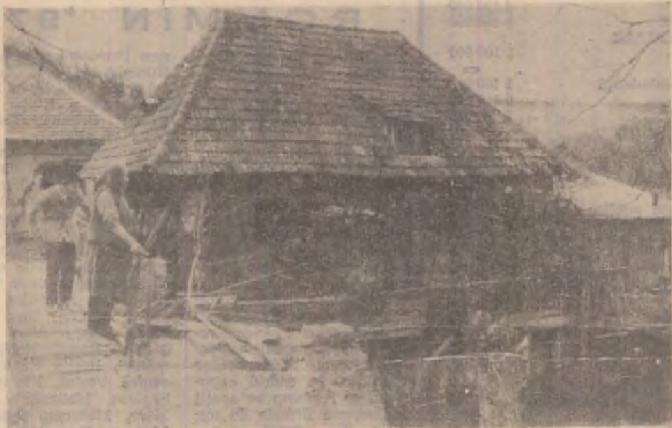
Vechea moară a Roșcanilor

nită cum arată și fotografia alăturată. Sătenii cer moara înapoi și susțin că, nu cu prea mare efort, s-ar putea repune în funcțiune. Cine ia această inițiativă?