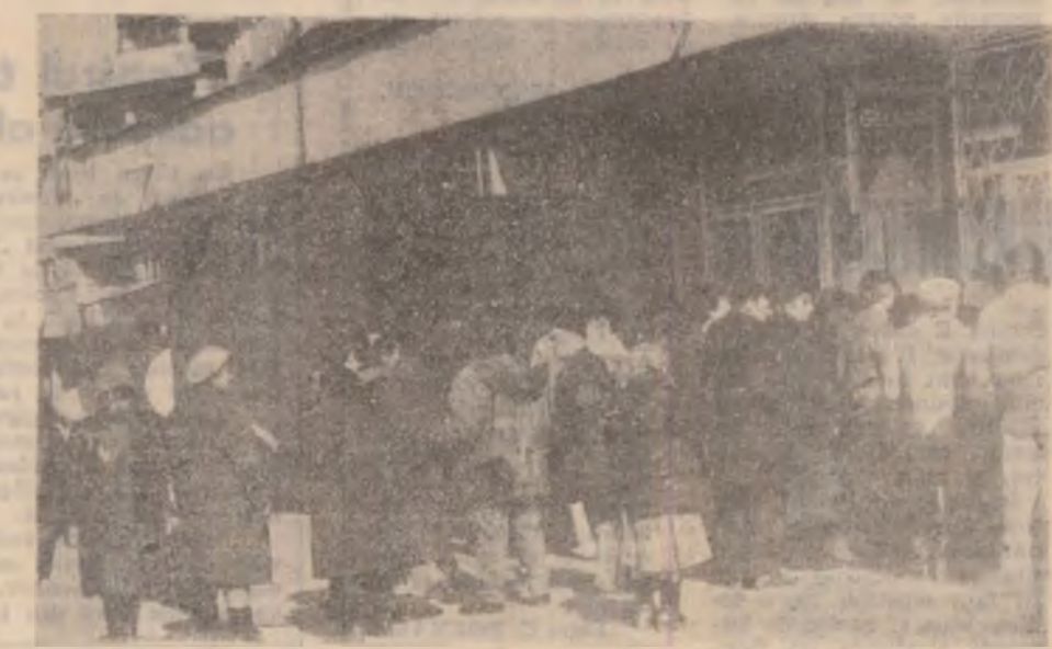
Au început să apară și cozile la vânzarea de... acțiuni.