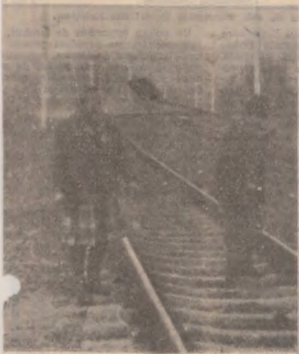
ine ori nu vine trenul?