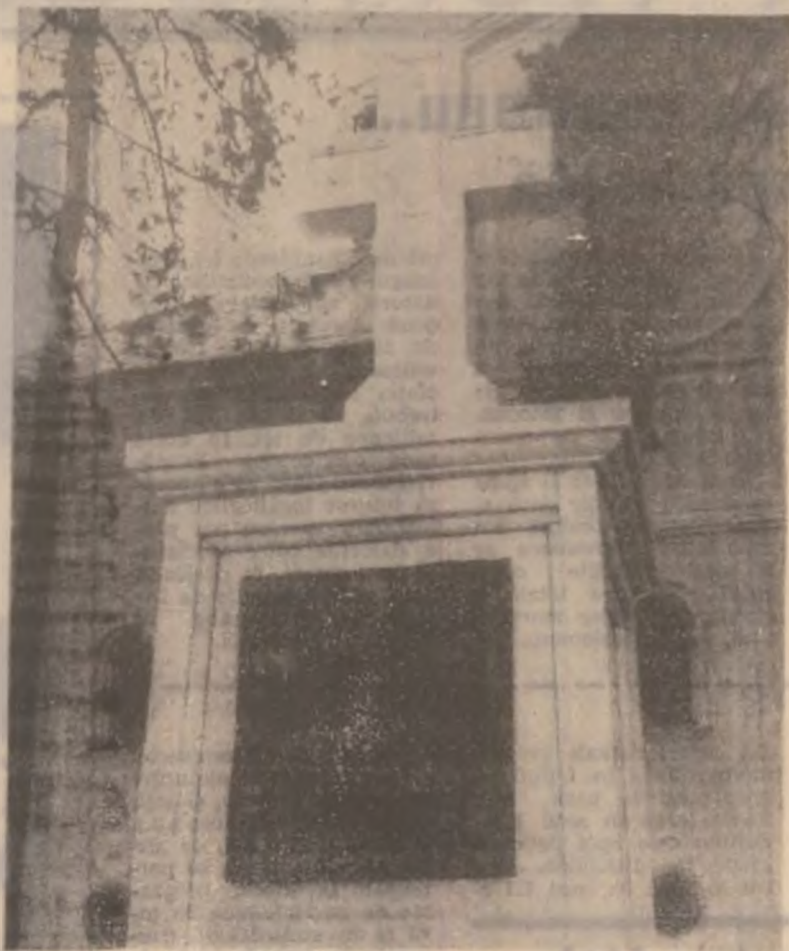
DEVA — Monumentul Eroilor situat în incinta Catedralei Ortodoxe „Sfântul Nicolae” din Deva.