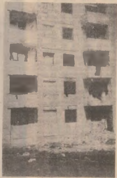
Hunedoara, str. Ștrandului. Lipsa de interes al locatarilor a condus la degradarea imobilului din imagine.

Cele două blocuri se află într-o stare avansată de degradare, ele fiind locuite doar de câteva familii, majoritatea dintre ele neavând încheiate contracte de închiriere cu RAIL Hunedoara.