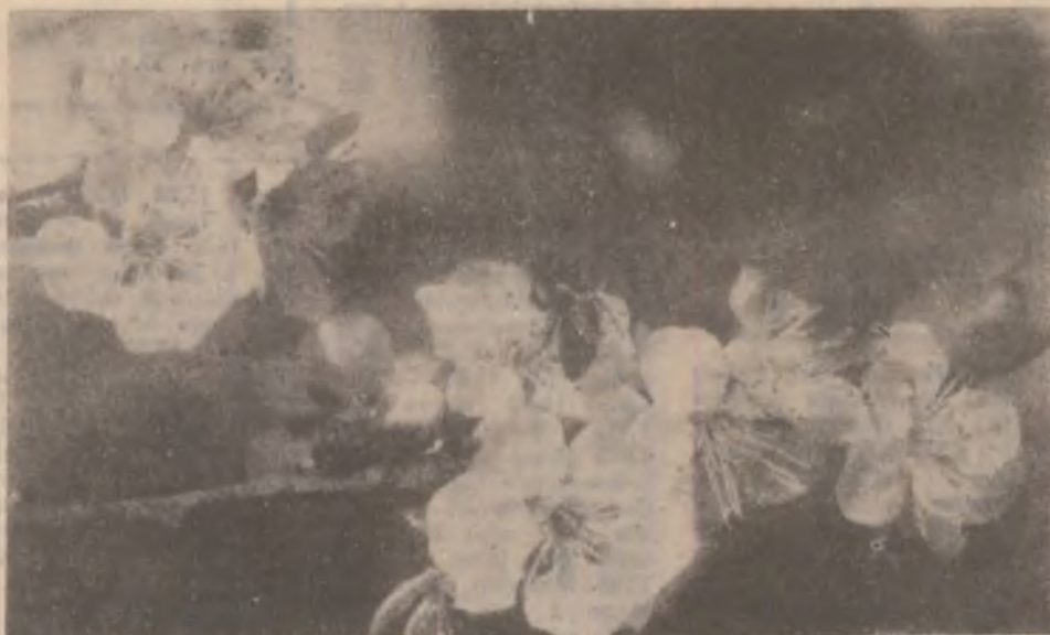
Flori de cireș