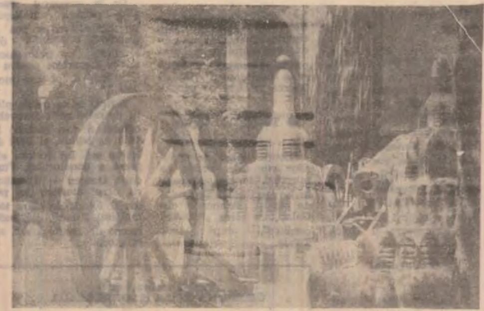
Un colț al aducerii aminte din parcul muzeu de la PLEVNA

care le încercam, așa cum le simțiserăm cu câteva zile în urmă la Plevna, la Grivița, pășind cu sfianță pe locurile de nesomn și vitejie ale eroilor... Ne întrebam dacă, acolo, pe pământul de dincolo de Dunăre, simțăminte ne-au fost mai adânci? Poate atunci, când am descoperit, la Grivița, strătuca țesută în nuanțele