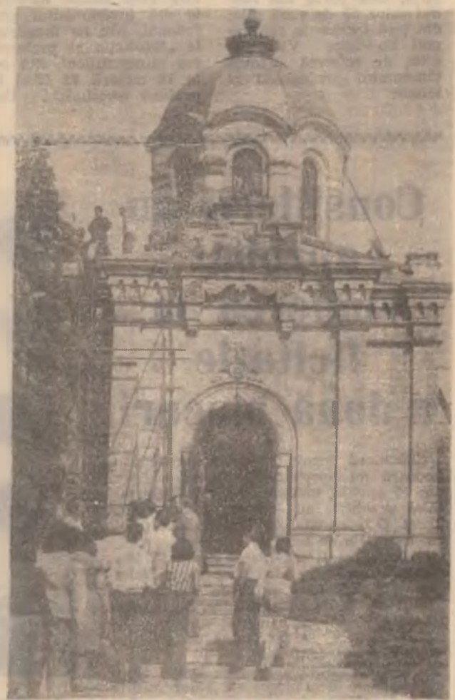
GRIVIȚA, Mausoleul din Parcul prieteniei româno-bulgare.