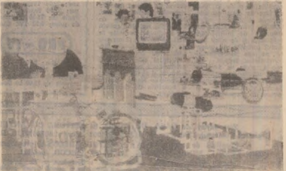
Aspect de la standul firmei Umrom din Petroșani

Cursurile incluse în această listă au la baza cotații ale societăților bancare autorizate să efectueze operațiuni pe piața valutară. Prezentă listă nu implică obligativitatea utilizării cursurilor în tranzacții efective de schimb valutar și înregistrări contabile.