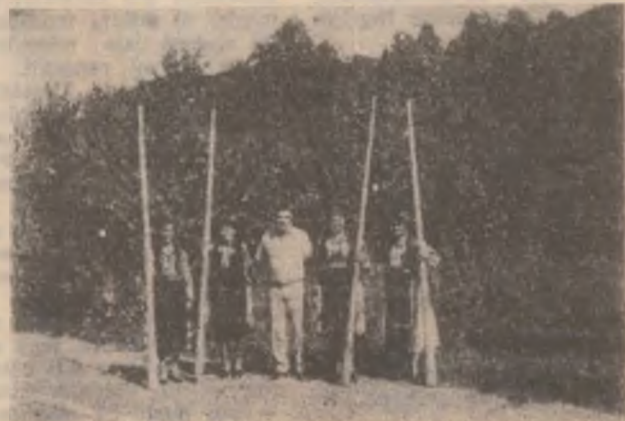
Tulnicărele hunedorene au fost la înălțime („la propriu și la figurat”) în Elveția.

La Lausanne, în Elveția, anual are loc un festival de instrumente folclorice tradiționale, cu participare internațională. La ediția din acest an, desfășurată în cursul lunii aprilie, țara noastră — respectiv județul Hunedoara a fost prezent pentru prima oară; aceasta, ca urmare a invitației primite de Casa de cultură din Deva, din partea Asociației de instrumente tradi-