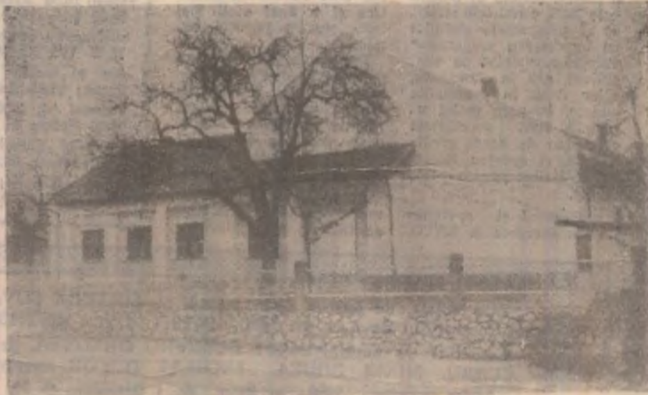
Căminul Cultural din Zam — reparat prin grija Consiliului local, o instituție de cultură, frumoasă, îngrijită cu atenție.