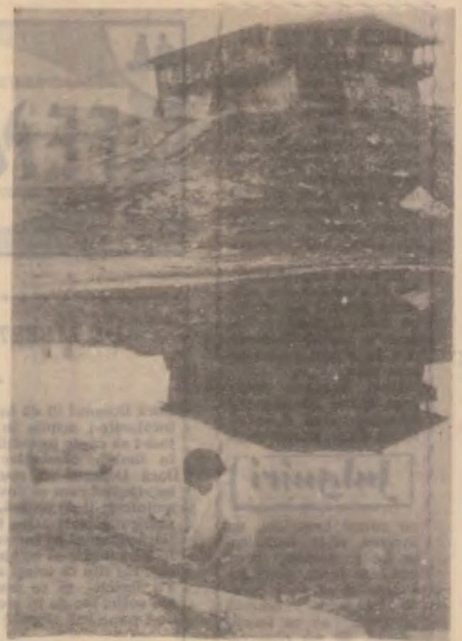
Cabana și lacul BILEA — din Muntii Făgăraș

Presiunea antropică foarte accentuată din județul nostru poate deter-