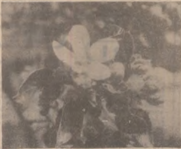
Flori de măr