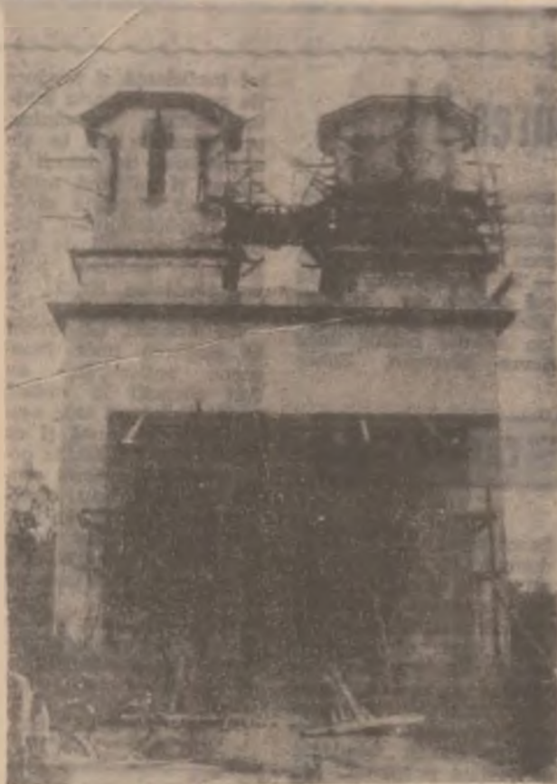
Sătenii satului Boz, com. Brănișca au reușit să înalțe o nouă biserică. Au fost terminate finisările exterioare.

Au fost trecute în revistă și acțiunile inițiate în țara noastră, având ca scop dezvoltarea satului, inclusiv cele din județul Hunedoara, în corelație cu demersurile pe plan mondial, arătându-se în concluzie că se pot înfăptui astfel de programe și în România, însă este nevoie de oameni pregătiți în domeniu, de crearea unor structuri și adoptarea unei legislații adecvate. La toate acestea s-a angajat să contribuie și noua confederație ce s-a constituit la Sighișoara.