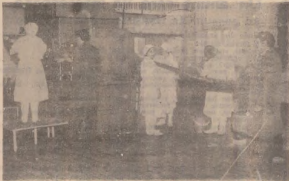
Pe fluxul producției la noua Fabrică de conserve din Deva.

cat 1,5 miliarde de lei, precum și construirea unei case mortuare, investiție ce absoarbe în acest an 400 de milioane de lei. Este avută de asemenea în vedere continuarea lucrărilor la extinderea rețelei de gaz. Deși este o criză acută de locuințe, fondurile cerute pentru ridicarea a o mie de apartamente sunt doar o poveste în care nu crede nimeni. (A. SĂLAGEAN)