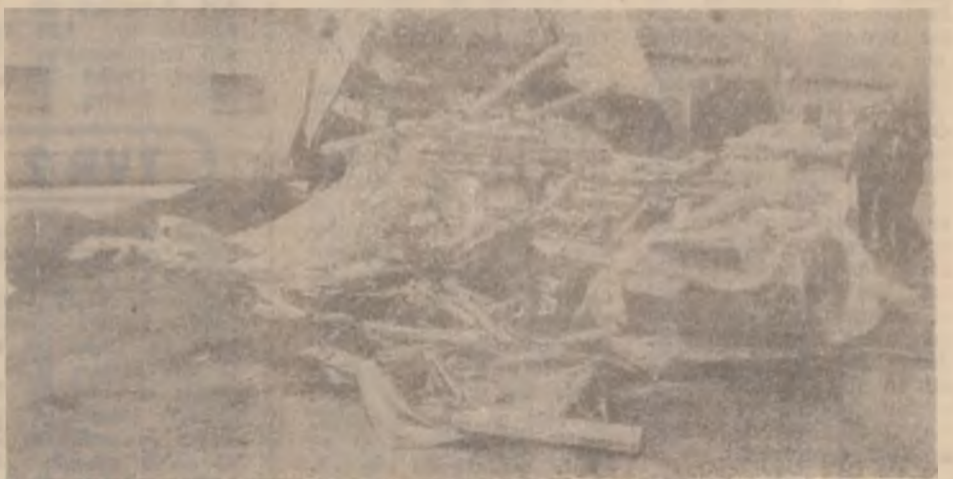
Doă motoare de vapor, căzute dintr-un TIR turcesc, au distrus un camion și au luat viața șoferului român.