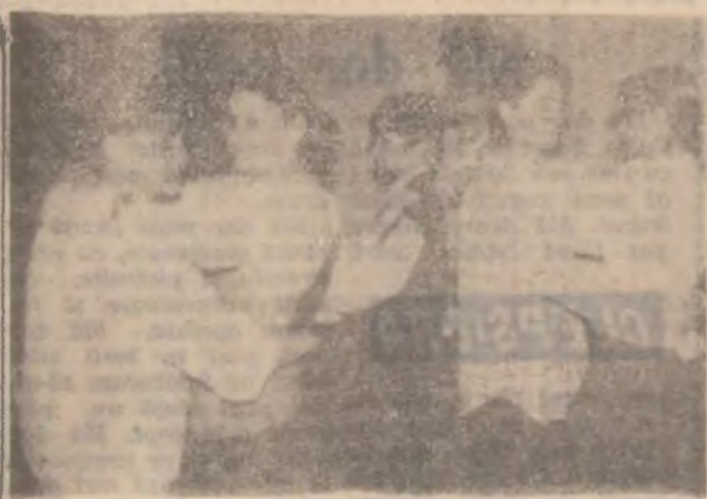
Concurs de dans la clasa a V-a a Școlii Generale Nr. 1 Deva.