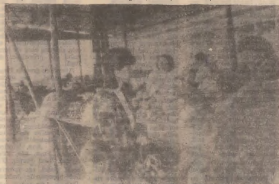
În piața din Uricani este marfă din abundență. Se pare că bani sunt mai pușini, întrucât gospodinele sunt destul de rare.

— Nu. Prețul este ca și la Arad de pildă dar aici marfa trece mai repede. Aduc la un transport 100—150 kg de brânză și într-o zi o vând.