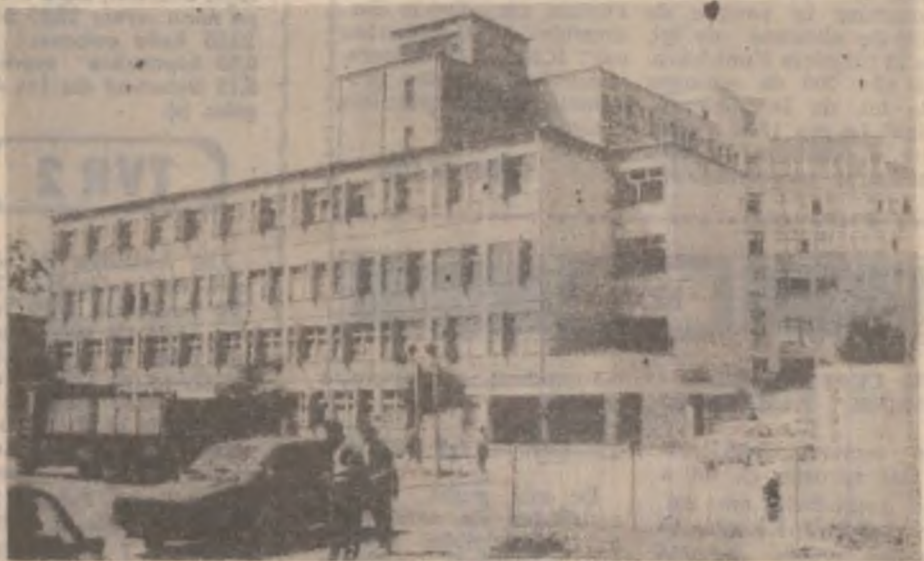
Spitalul din orașul Hațeg.