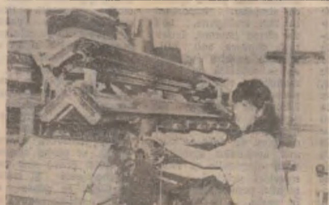
La mașina de tricatat.

croitorie, retușând, pe măsura clientului, anumite obiecte vestimentare. După moda hamburghezilor, a fast food-urilor, a barurilor cu terasă și biliard, se pare că și atracția pentru acest comerț cu haine second hand de import este în declin, efervescența de început fiind inocuită, treptat, de placiditatea rutinei. Driblând permanent printre pretențiile, uneori absurde sau rău voitoare ale clienților, recomandând un produs sau altul, întreprinzătorul n-are însă de ce să se teamă. Atâta timp cât industria românească de profil produce cu mult mai scump, dacă nu mai puțin aspectuos iar prețurile hainelor de import noi sunt prohibitive pentru majoritatea românilor, soluția second hand-ului pare a fi optimă, născută fiind sub presiunea conjuncturii.