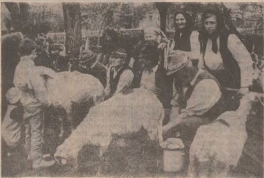
Sătenii localității Peșteana pregătesc plecarea oilor la munte. Aspectul din imagine reprezintă mulsul oilor de către fiecare proprietar, în raport cu cantitatea de lapte obținută, stabilindu-se câte zile trebuie să îngrijească oile și câtă brânză să primească.