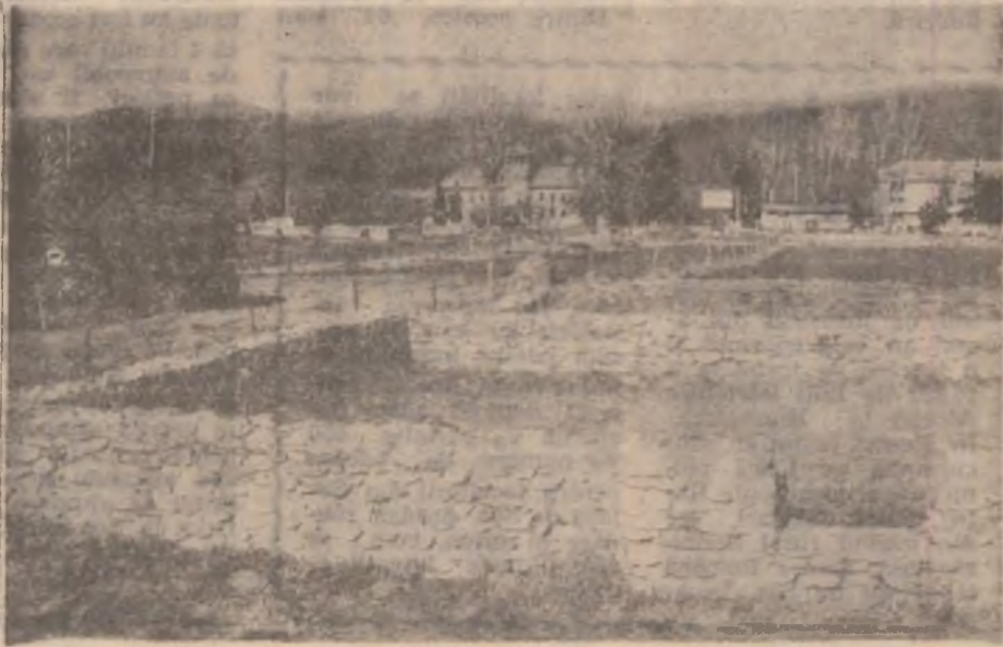
SA..MIZEGETUSA. În jurul ruinelor terenul aparține localnicilor, spații unde se ară cu tractorul, se cosește, iar animalele pase în voie. Lăturile sunt îngrădite cu sârmă ghimpată, iar în incinta grădiniilor se află ziduri de relevanță istorică. Pe când o lege a patrimoniului, prin care istoria neamului să fie apărată, cetățenii să fie despăgubiți corespunzător acolo unde este cazul?!

Importanți, infatuați, aroganți și nonșalanți, neofitiți se înșurubează în câte-un domeniu de activitate cu aerul că, fără ei, lumea și țara ar cădea în ghearele unui iminent cataclism. Ei nu recunosc, dar se cred „multilateralii” preconizați de sistemul socialist, deghizați acum sub inocenta sintagmă „oameni de afaceri”, sau sub englezescul „manager”, ca să facem uz de „românească” actuală... Acesti magici manageri are pentru unii efectul scărpinării porcului pe burta, să nu mai vorbim dacă el se suprapune unei funcții pe măsura idealului. Iar în ultima vreme numai de idealuri carieristo-ierarhice nu duce lipsă românul Drept care s-a dezlăntuit o luptă politico-administrativă fără precedent, denumită codificat răfuială, în cadrul căreia oricine crede că i se cuvine orice func-