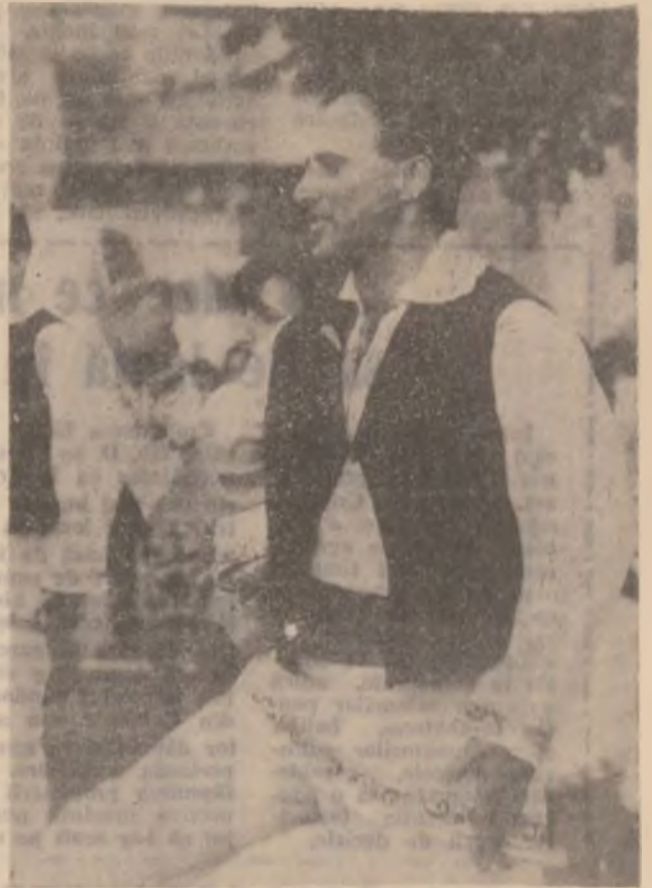
În iureșul dansului