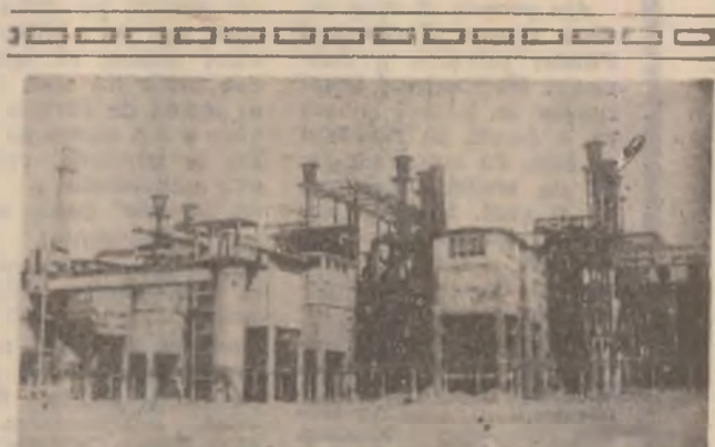
Cășeria din Călan, astăzi un muzeu în aer liber.