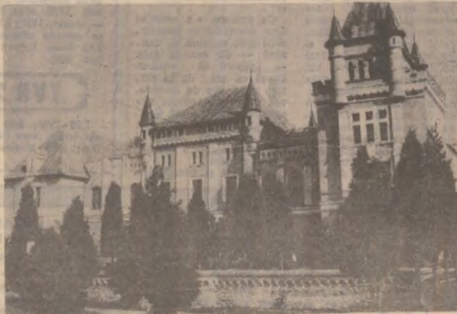
Castelul din Sântămărie Orlea.

În prezent, Corpul Gardienilor Publici din județul Hunedoara asigură paza la un număr de 59 agenți economici și inst.