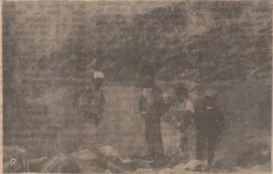
Munții Retezat - Iacul Bucura. „Măine vom urca pe Acoperișul Lumii!”.

Vineri, tot la Casa de Cultură Deva a avut loc un alt spectacol de caritate dedicat Zilei de 1 Iunie, în beneficiul copiilor defavorizați. El a încheiat acțiunile organizate de Serviciul Social Județean de Ocrotire a Copilului în săptămâna ce a purtat denumirea. Să facem împreună o lume mai bună!