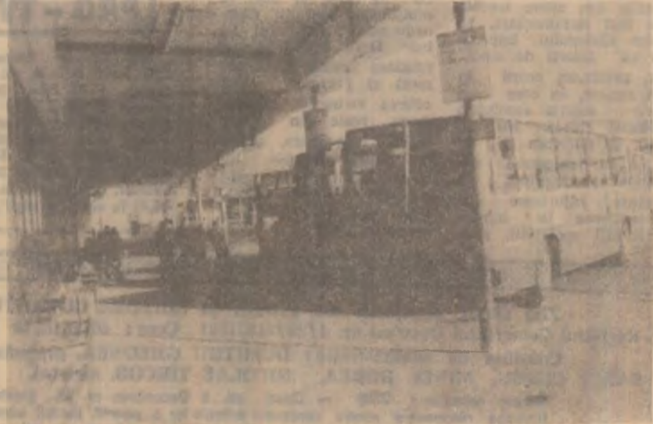
Autogara din Deva.

C.S. Olt au fost penalizate cu câte 25 de puncte, și amendă 25 milioane lei, iar Petrolul Țicleni, 20 puncte penalizare și 20 milioane de lei amendă. Se interzice promovarea în acest an a unei echipe din seria a III-a în Divizia A.