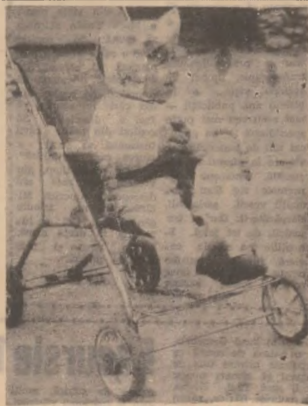
Astăzi e ziua mea!