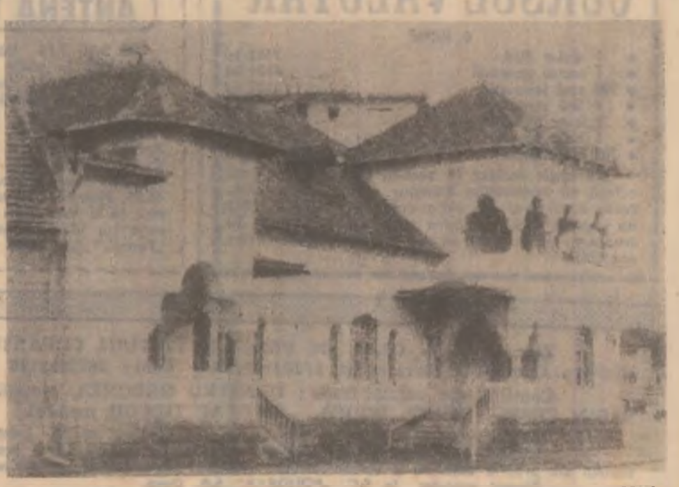
Biblioteca din Municipiul Brad.