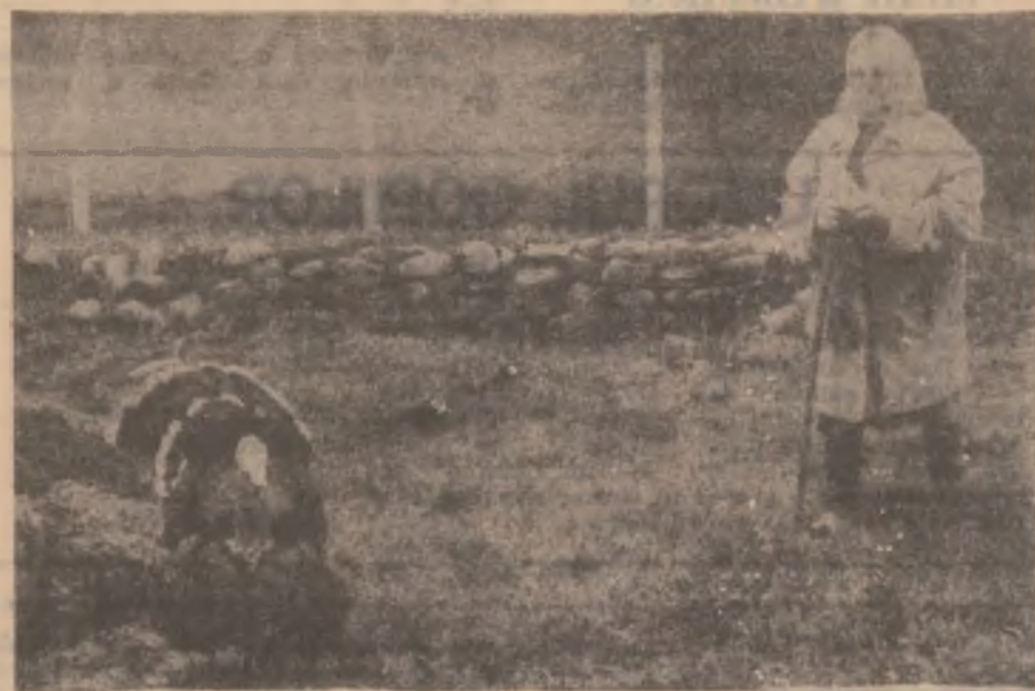
Bunicuța și curcanul.