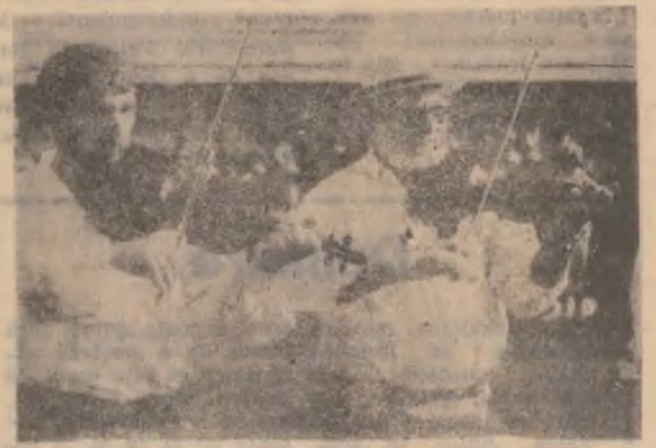
Mesagerii ai cântecului popular danez.

emisiune TV, pe stradă, un tânăr este întrebând ce-a mai citit în ultimul timp („ultim timp" însemnând după Revoluție!). Răzând timp, pletosul — cu aer de student — răspunde cu prostia lui oniclopodică: „In ultimul timp n am citit nimic. Nici nu mă interesează capitolul ăsta!". ● Prin cartier, niște cucoane își plimbă câinii. Ritualul se derulează după reguli de neînțeles pentru muritorii de rând. Cucoanele lasă impresia că ele au inventat câinele pe planeta noastră... ● Semeni, nu mă judecați acum! Lemnul de santal trebuie mai întâi să ardă, ca să ți dai seama cât de frumos a miroșit... ● Nicolae Iorga: „Cel mai nedrept lucru pe lume e să ceri cuiva să fie umil pentru că tu ești obraznic".