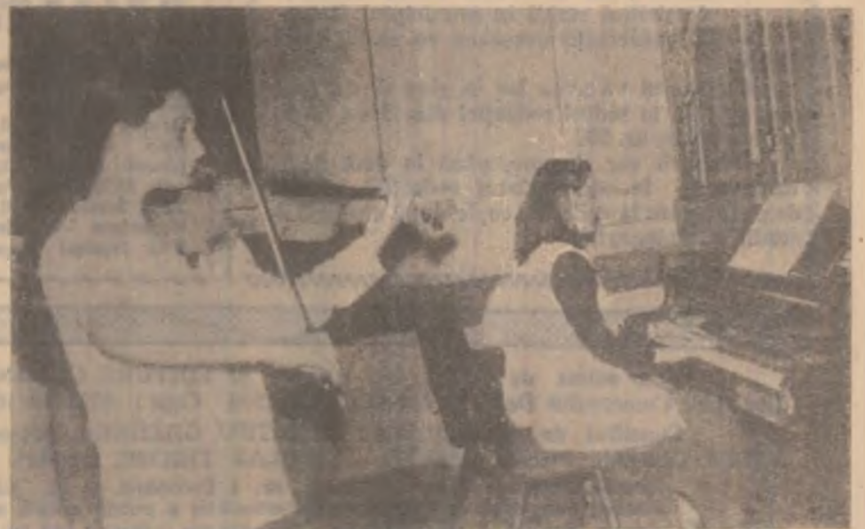
Aspect din timpul Festivalului muzical național „Sabin Drăgoi”.