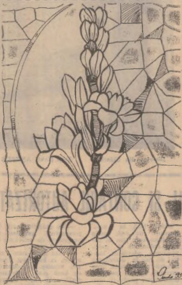
Desen de PAULINA POPA