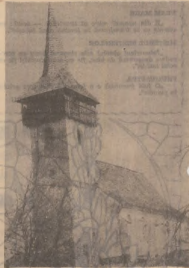
Biserica din Sâncsești.

Pentru cadrele didactice din județ a fost realizat un centru de informare și documentare. Centrul, realizat în sediul Inspectoratului Județean Școlar, cuprinde materiale din diverse domenii (legislație, buletine informative, documente referitoare la integrare, lucrări în limbi străine, lucrări științifice ale profesorilor ș.a.). (V. R.)