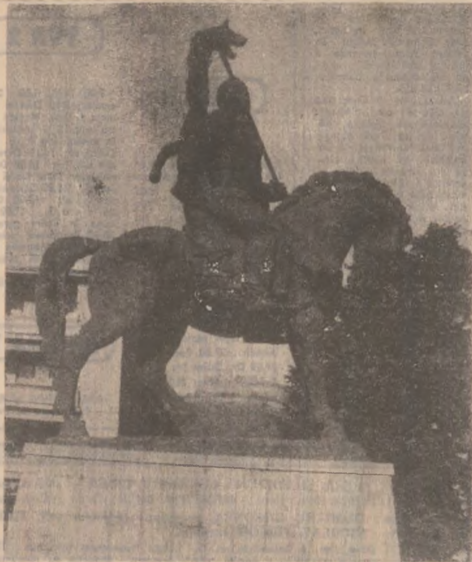
Statuia ecvestră a regelui dac Decabal, realizată de sculptorul Ion Jalea, amplasată în centrul municipiului Deva.