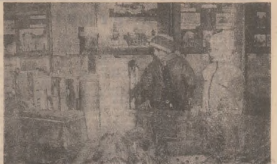
În vizită la castelul din Hunedoara.

● De remarcat — pe toate cele cinci cauze penale cu judecător am putut citi: „lovire”.