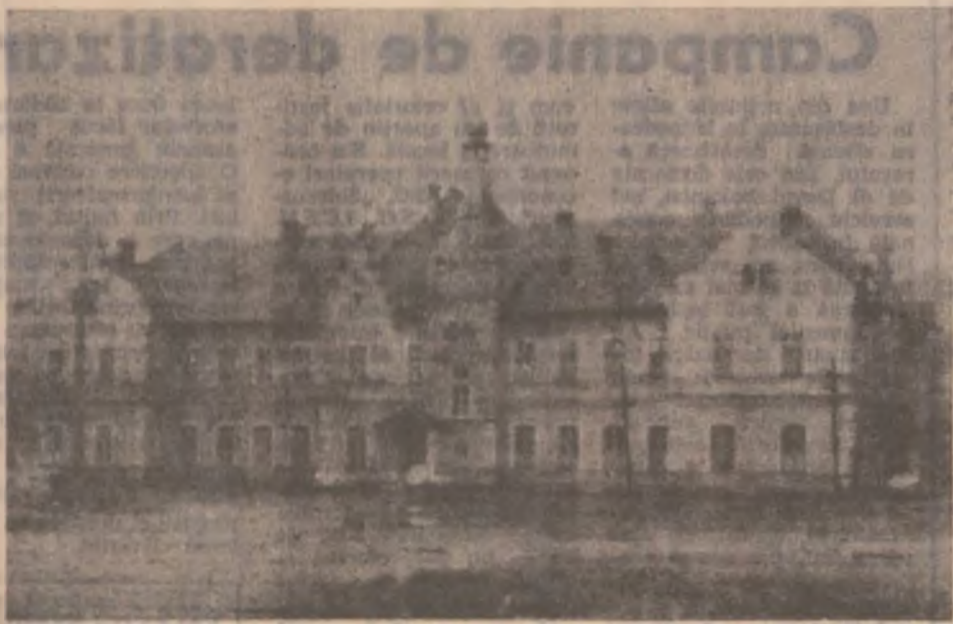
Prin gara din Brad trec zilnic mulți cetățeni.

Rubrică realizată de ION CIOCLEI cu sprijinul I.P.J. Hunedoara