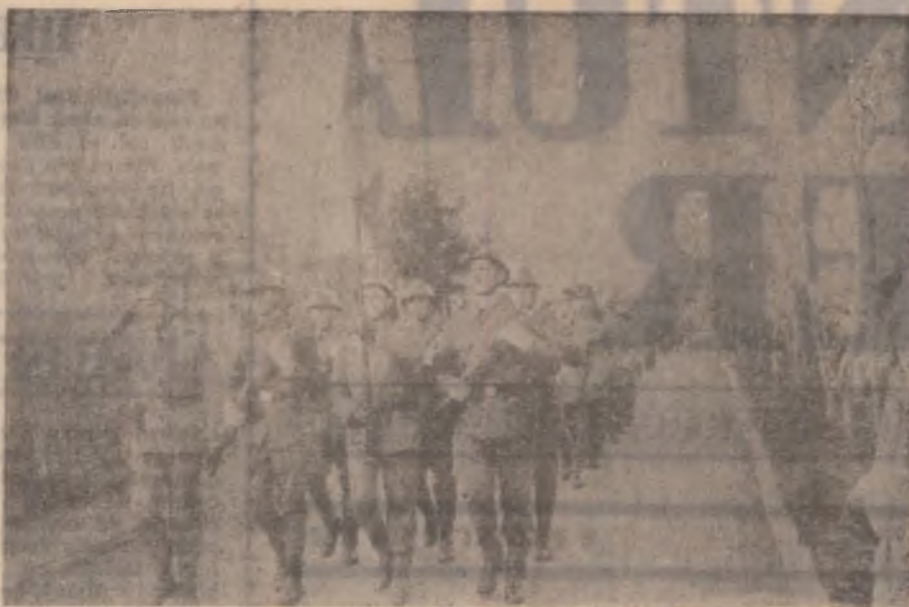
În pas de defilare.

Printr-o hotărâre a Consiliului local al municipiului Hunedoara a fost consolidat un fond de premiere destinat elevilor hunedoreni cu rezultate notabile la olimpiadele școlare. Numărul total al celor premiați se ridică la 106, din aceștia 11 obținând premii iar restul mențiuni. Premiile oferite de Primărie sunt substanțiale pentru