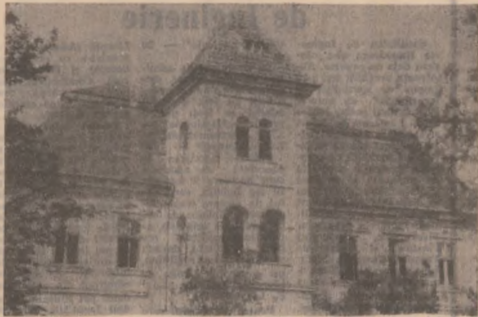
Castelul din Nălaț-Vad.

să „abolească granițele dintre realitate și artă, dintre public și artiști” (în cazul lor viitori artiști). Avangardiștii deveni și-au început aceste „ieșiri” în prima zi însorită. Ele vor continua zilnic, în diverse zone ale Devei, chiar și în vacanță. La prima lor manifestare publică cei de la muzică și-au încântat spectatorii ocazionali cu puritatea vocilor și candoarea vârstei, iar graficienii „și-au început studiul formelor citadine și transformarea lor în imagine plastică”. (V. ROMAN)