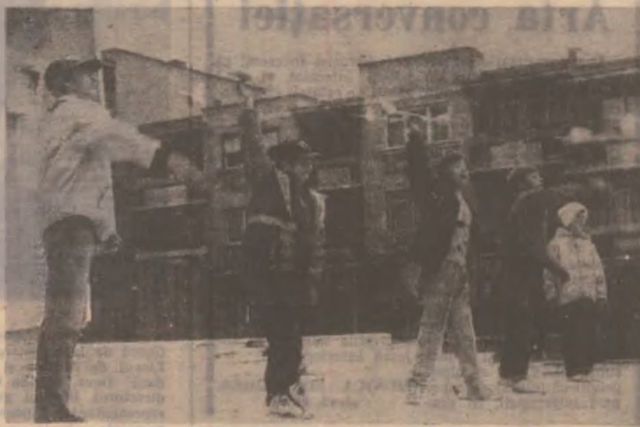
Deva. Tineri de la Clubul elevilor, mari meșteri și modelele lor zburătoare.

Rubrică realizată cu sprijinul IPJ Hunedoara