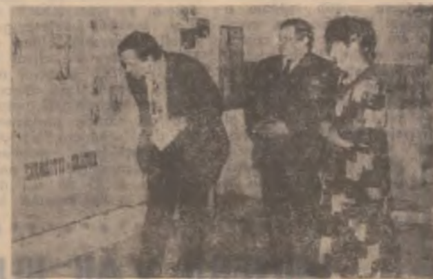
Aspect de la vernisarea expoziției Taberei de pictură Cinciș, ediția a XVII-a.

Tabăra de pictură de la Cinciș constituie un punct de reper nu doar pentru artiștii plastici hunedoreni, ci și pentru locuitorii municipiului, beneficiarii ai creațiilor acestora. Iar „recolta” ultimei ediții a taberei merită văzută (lucru posibil până spre sfârșitul lunii). (V. R.)