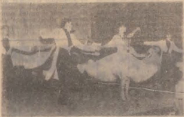
Dans de societate — moment din spectacolul oferit de formațiile Clubului „Siderurgistul” Hunedoara salariaților S.C. „Siderurgica” S.A.

7,00 Dulce ispită (s); 8,30 Desene animate; 8,40 Safari (doc); 9,00 Max Glick (s); 9,30 Farmacia de gardă (s); 10,00 Fire in the Dark (f); 11,30 Odissea (doc); 12,30 Cu camera ascunsă (s); 13,00 Videotext; 17,00 Dulce ispită (s); 18,00 Desene animate; 18,30 Tavernole lumii (s); 19,00 Max Glick (s); 19,30 Farmacia de gardă (s); 20,00 Ani de glorie (f); 21,30 Odissea (s); 22,30 Brigada de șoc (s); 23,00 Merca II (f); 0,30 Serial erotic; 1,30 Videotext.