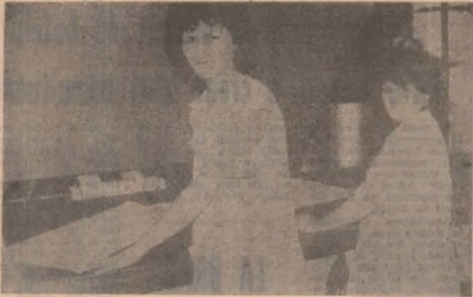
„Un surâs... la început de vară” face bine nu numai frumuseții femeilor ci și pentru productivitatea muncii.