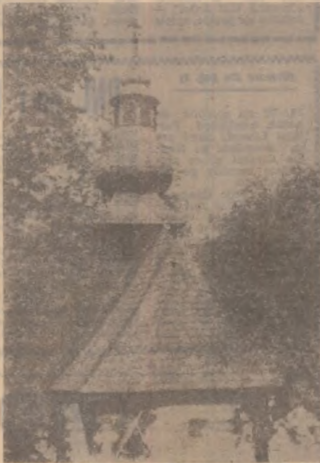
Biserica din Ocișor.