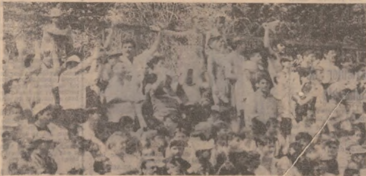
Aceiași suporteri ce au aplaudat victoria devenilor în meciul lor cu F.C. Drobeta Tr. Severin au făcut o călduroasă primire fotbaliștilor de la Vega, la întoarcerea la Deva, după meciul de baraj.