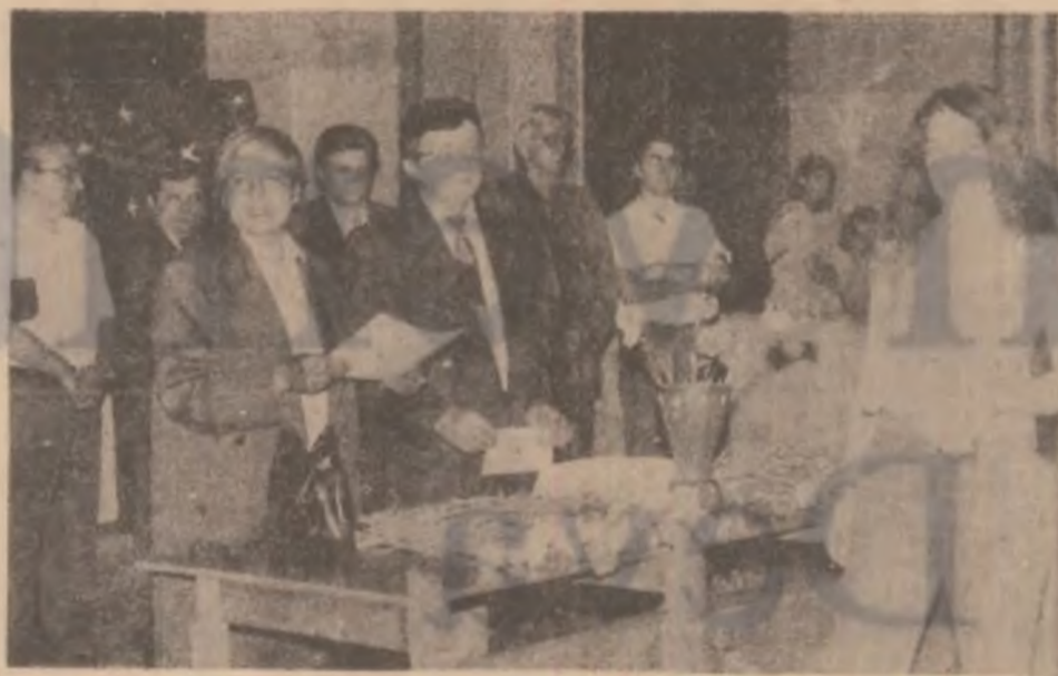
Festivitate de premiere a olimpicilor hunedoreni.