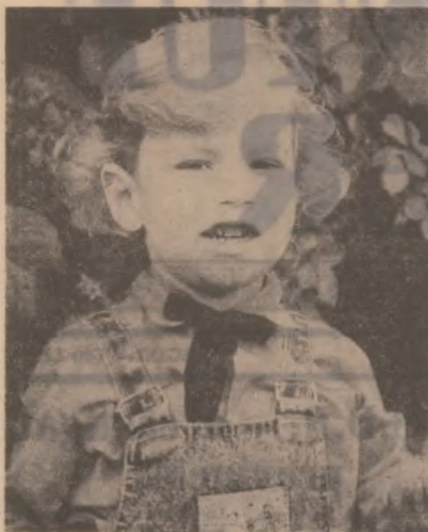
„Vara la vie”.

prea puțini pentru marea număr de ore care se profilează. Iar suplinitorii, cu excepțiile de rigoare, fie că sunt absolvenți de liceu încă ei înșiși necopți, fie că sunt pensionari de toată mâna, plâfonați, depășiți sau, uneori cum s-a văzut, chiar perverși, nu fac decât să compromită religia ca disciplină școlară. Religia ar trebui să devină cea mai iubită „materie”, colocvială, plină de culoare, fabuloasă, scoasă de sub teroarea notărilor de rutină și a tocilei papagalicești. Să sperăm că clasele teologice ale școlilor normale și secțiile pedagogice ale facultăților de teologie, de curând instituite, vor împlini acest deziderat. Cum ziceam, ne aflăm în fața unui început. Dacă nu-l vom rata — cum am ratat începutul „tranzicției” — religia are șansa să devină iar ceea ce trebuie să fie: pilonul central al culturii umane.