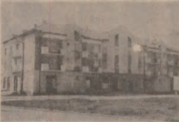
La Beriu, o parte dintre locuitorii locuiesc în acest bloc, al cărui subsol este plin cu apă.

Material realizat cu sprijinul Oficiului Județean de Protecția Consumatorilor Hunedoara