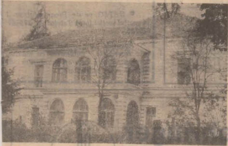
Spitalul din ZAM

lar cel mai bun transport cu autobuzul pe ruta Deva — Vărmaga. Mulțumirilor le alătură și urări de bine pentru cei care i-au ajutat. (V.R.)