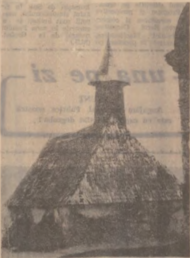
Așa arată acum Biserica din RUDA — GHELAR

În aceste unități funcționează ATERIV PENTRU PRIMIREA ANUNȚURILOR DE MICĂ ȘI MARE PUBLICITATE.