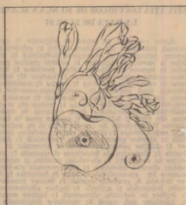
Desen de PAULINA POPA

● Nu se pune sa supă decât după ce bine spuma. ● Când pregătești caramel, turnați și 5-cături de oțet sau i de lămâie.