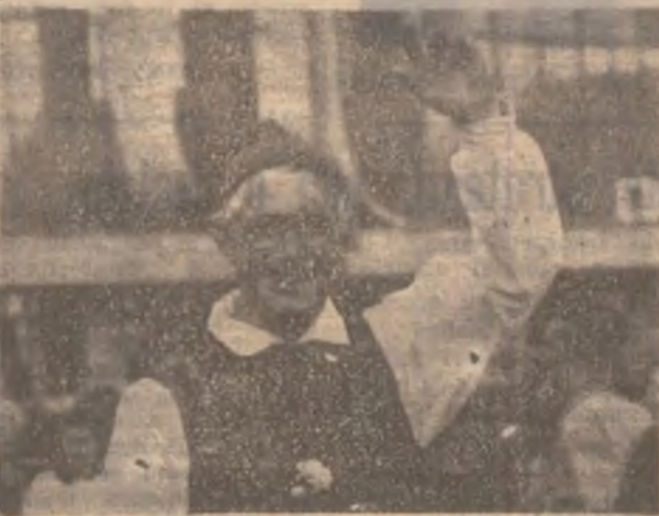
Un cald și prietenesc salut danez adresat de-venilor.