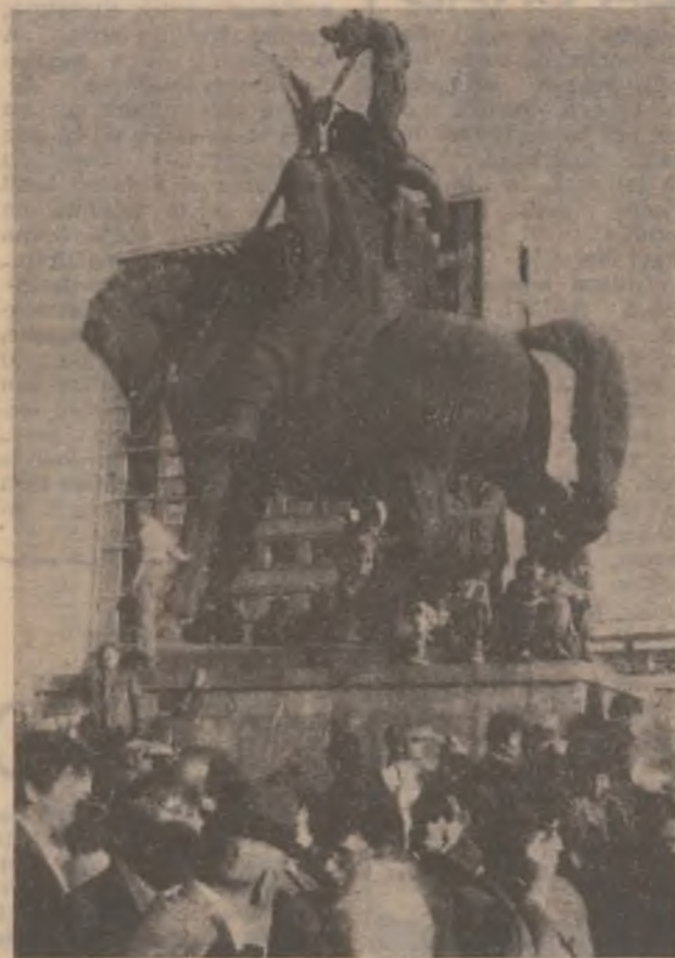
Balada lupului alb.