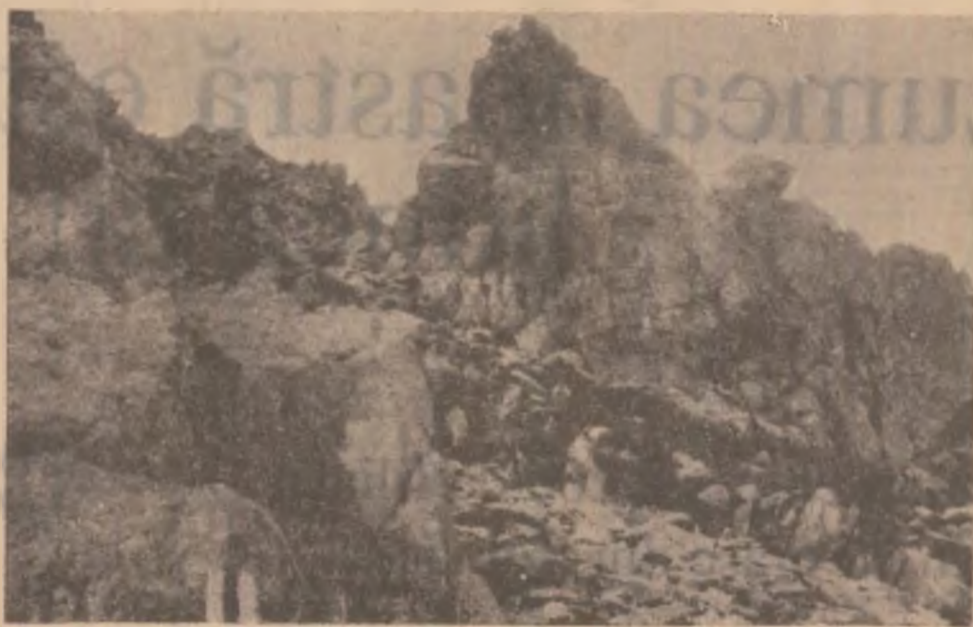
Parcul Național Retezat. Creasta Bucurei.