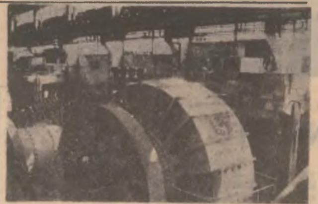
Trecând prin preparație, minereul extras de la E.M. Certej capătă valențe noi.