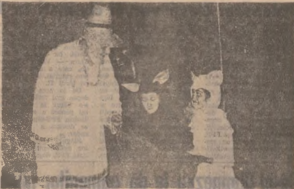
Scenă din spectacol: părintele Ghervasie și cei doi pisoi.

rul și călugăria ortodoxă. Postul Mare al Paștelui, trăit și comentat — în prima parte — de către cei doi călugări habotnici, la modul ridicol, trăit și comentat în partea a doua a come-