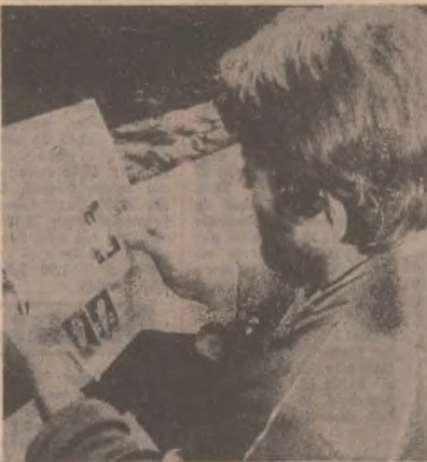
După o zi intensă de muncă, omul de la țară găsește un moment de odihnă binc meritul și citește ziarul.