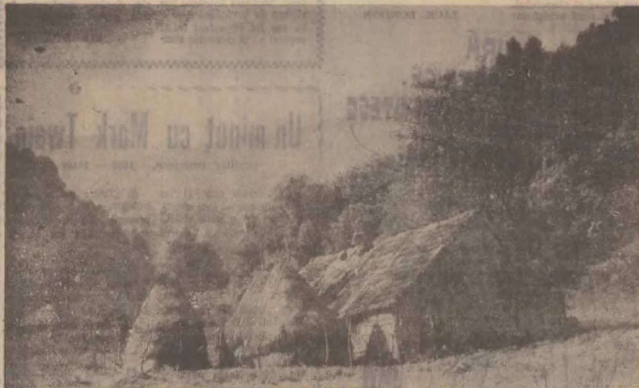
Pe valea Râului Mare

insistențele Sindicatului liber din instituție condus