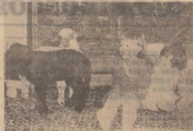
Cine ești tu ... ?

Deci, revin moșierii? Nu știm, dar oricum asupra inițiativei celui mai puternic partid din coaliția ajunsă la putere va stârni dezbateri foarte aprinse. Și s-ar putea — chiar dacă CDR are majoritate parlamentară — propunerea respectivă să fie respinsă de legislativ. Ce va fi — vorba românilor — om trăi și-om vedea. (Tr. B.).