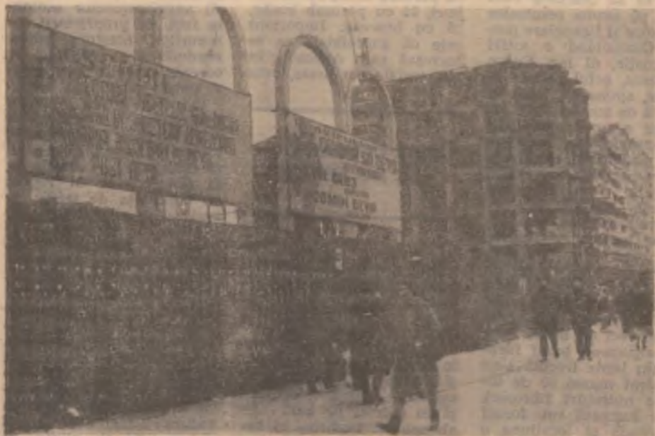
Se construiesc noi sedii pentru instituții județene.

de Semnal M Riff California Road. Moderatoarea programului este cunoscuta prezentatoare TV Christel Ungar. Intrarea este liberă. Accesul este permis începând cu ora 17. În caz de timp nefavorabil, concertul va fi amânat pentru a doua zi. (M.B.)