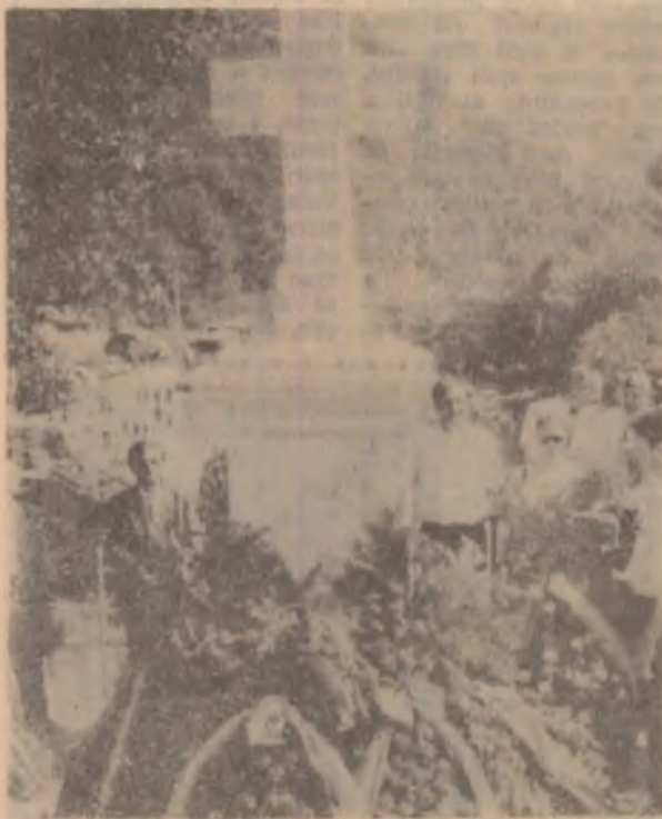
La Crucea Iancului de la Dupăpiatră s-au depus în semn de adâncă cinstire coroane de flori.

Pentru a urca la Crucea Iancului, localnicii au construit trepte de beton. Aici, la acest monument, au fost depuse duminică coroane de flori în acor-