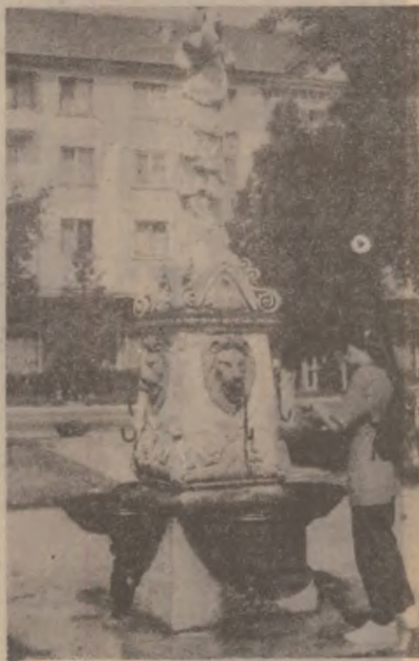
Hațeg, singurul oraș din județ unde trecătorul găsește în centrul orașului o fântână artiziană cu apă potabilă la care poate să-și potolească setea.