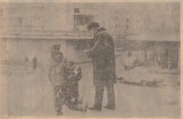
Tigara noastră cea de toate zilele pentru... domni ca și pentru cerșetori.

Conferința a adoptat, într-o atmosferă înflăcăută, textul unei scrisori deschise către dl Miron Cozma în care i se urează sănătate, demnitate și fermitate pentru a depăși momentele grele prin care trece, i se promite sprijinul deplin material și spiritual al minerilor din Valea Jiului și se promite că se fac eforturi ca până în 25 august — ziua sa de naștere — să fie pus în libertate. (Tr. B.)