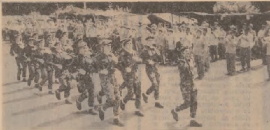
Detașamentul vânătorilor de munte de la U.M. Brad, care a organizat o ambuscadă duminică la Dupăpiatră.

Exercițiul, după cum afirma comandantul detașamentului de militari, a fost prezentat cu dorința de a mări și consolida încrederea pe care poporul o are în instituția desemnată de Constituție să apere independența, libertatea și neatarnarea țării. Armata română a fost întotdeauna numai a poporului român!