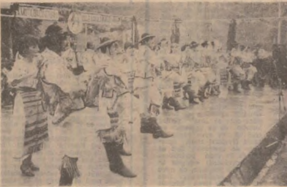
În scenă, ansamblul folcloric „Doina Mureșului” al Casei de cultură Orăștie.

ratului Județean pentru Cultură. Și-au dat concursul cunoscuta formație de tulnicărese din Blăjeni. Ele aduc mereu în atenție instrumente ar-