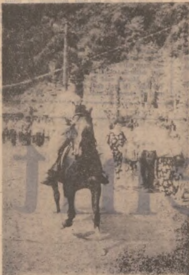
Observator civil călare la aplicația militară de la Dupăpiatră.