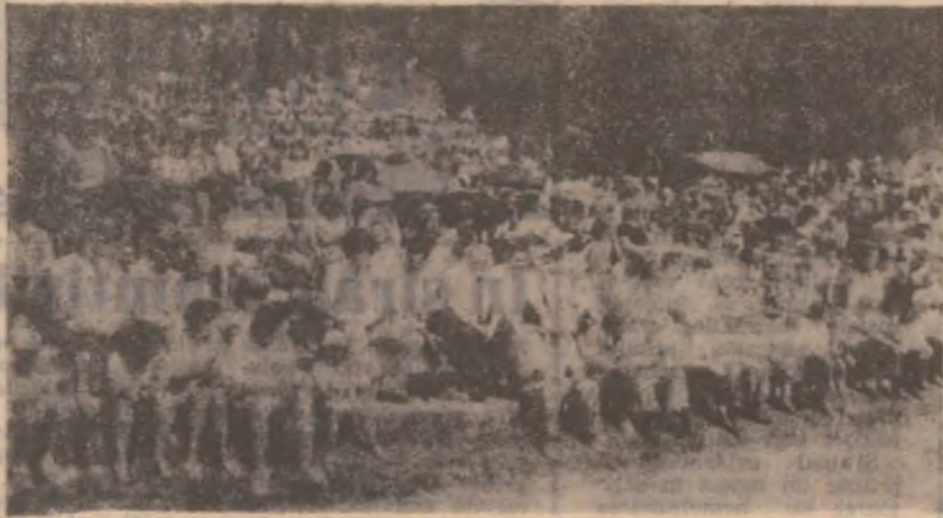
Miile de moși s-au revărsat duminică la Dupăpiatră, pentru a participa la manifestările din cadrul celei de a XXV-a „Intâlniri a moșilor cu istoria“.