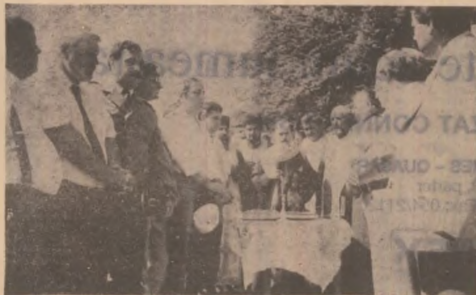
Slujbă de pomenire pentru Avram Iancu și ceilalți eroi ai Apusenilor.