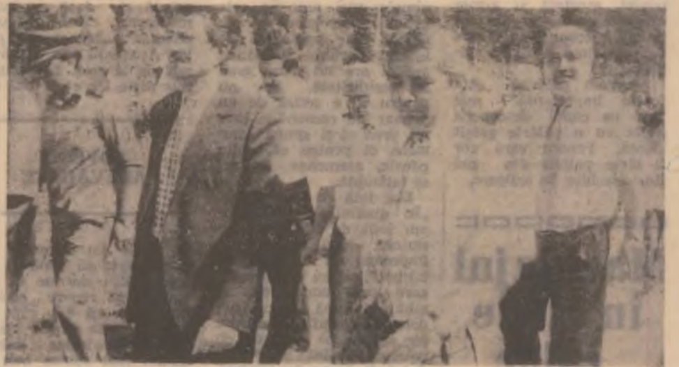
Reprezentanți hunedoreni în Parlamentul României și administrația județeană — Consiliul județean și Prefectura.