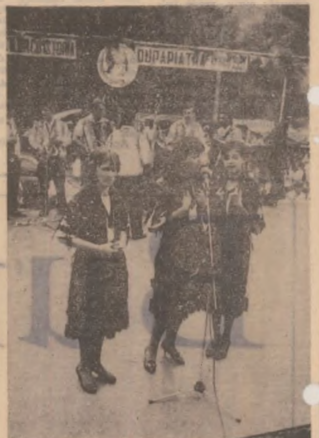
Artiști în scenă.