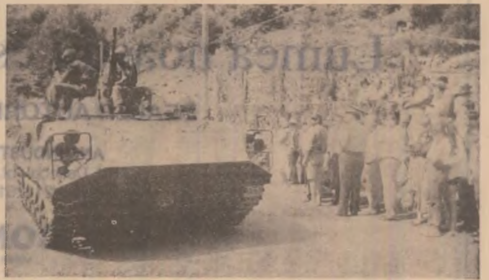
Blindată pe șenile, al cărei echipaj a participat la ambuscada de la Dupăpiatră.