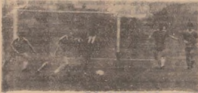
FOTBALUL ATRAGE MEREU PE STADIOANE NUMEROȘI SUPORTERII...