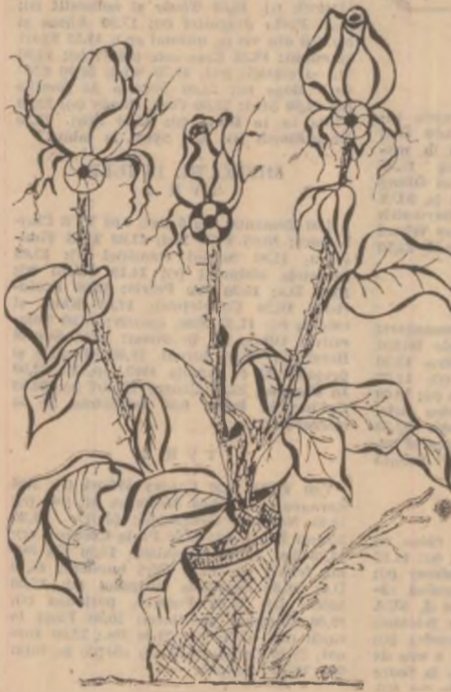
Desen de PAULINA POPA