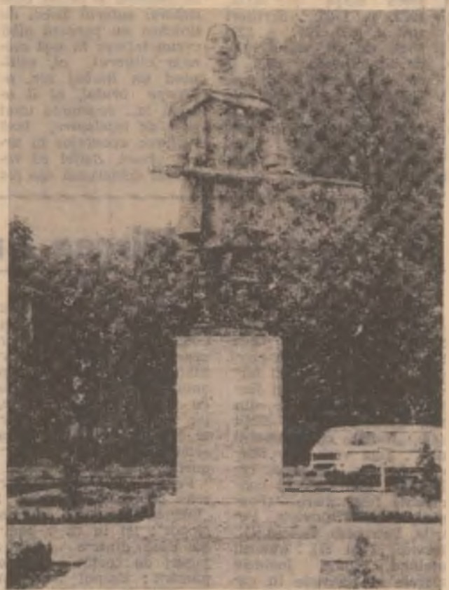
În orașul de pe Cerna străjuiește statuia lui Iancu de Hunedoara.

color, marca Goldstar, în valoare de aproape 3 milioane de lei. Donația este menită a mai îndulci suferința micilor bolnavi care pot urmări acum difuziunile pe canalele de televiziune.