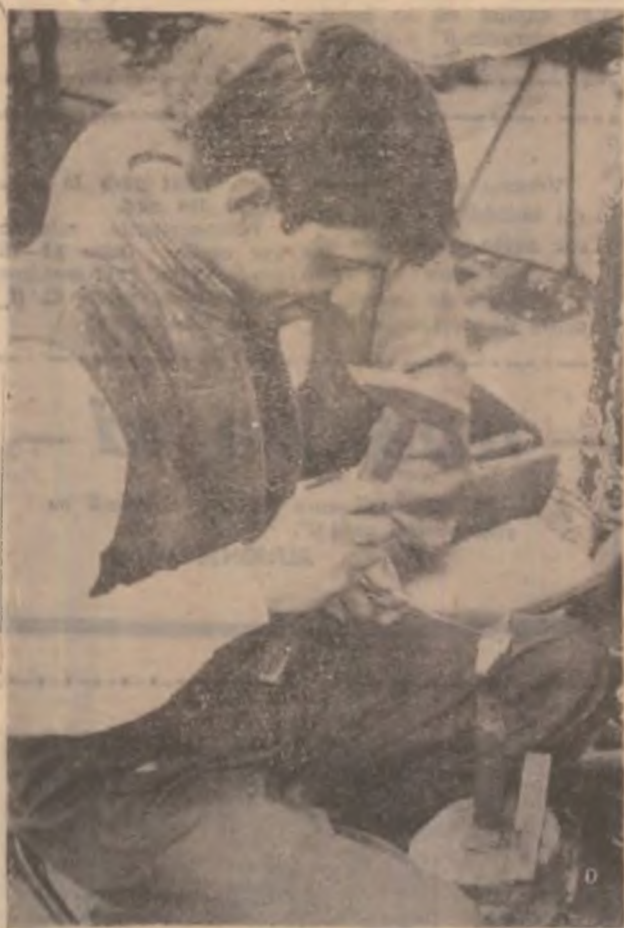
Unul dintre puștii romi care mai practică acea frumoașă îndeletnicire de confecționer de obiecte de poartă. Acest tânăr poate fi întâlnit în marea piață din Petroșani.

acasă, noi efectuând în continuare tratamentul prescris”. În orele de program la dispensar sau în vizitele pe teren, la locuințele sătenilor, cadrele tehnico-medicale, doctorii se îngrijesc cu profesionalism și dăruire de viața oamenilor, alinându-le durerile, readându-le sănătatea, puterea de a munci și trăi alături de cei dragi și apropiați.