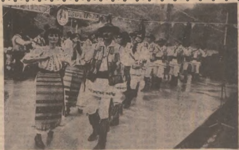
Ansamblul folcloric al Casei de Cultură Orăștie pe scena de la Dupăpiatră