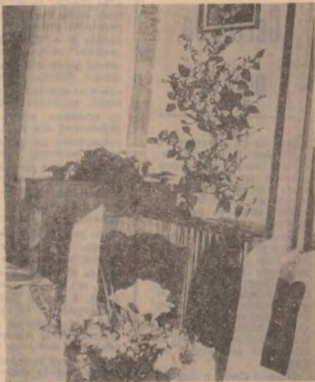
Elegantă și confort în localul reamenajat al Stațiunii Vața de Jos.

I.M.: Trebuie să spun că stațiunea Vața există pentru că avem apă termală. Ea este a „Romtelecom”, ce va folosi 50 la sută din locurile ce există aici, restul e pus la dis-