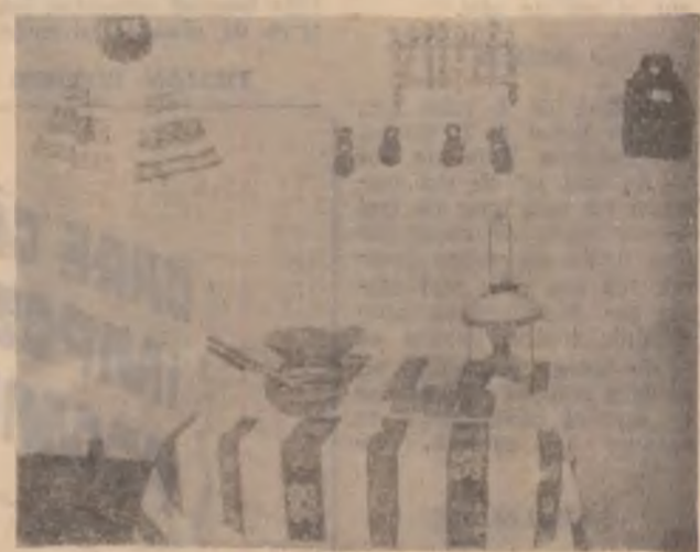
Aspect din Muzeul din Brad — Secția de etnografie și folclor.