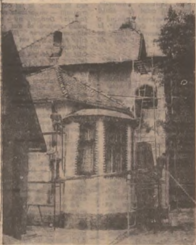
Oamenii ai S.C. Tom SRL renovează sediul Primăriei și Consiliului local Petrila.