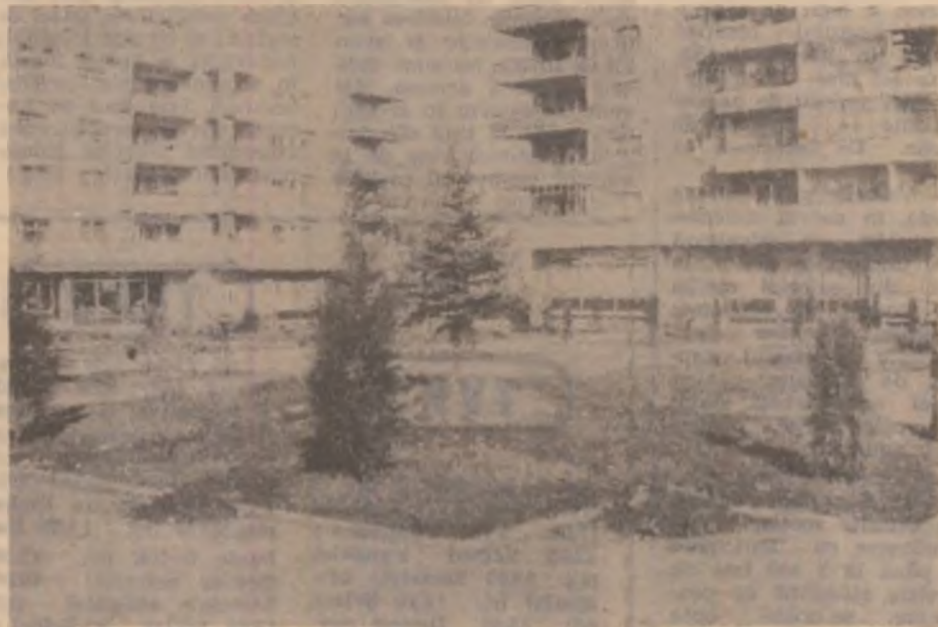
Noul parculeț din Simeria.

În culmea furiei, șeful tipă la subaltern: — Am să-ți fac viața un iad! — Nu puteți. Sunt căsătorit.