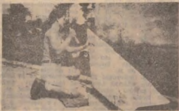
Una din studente lucrează la un vitroz „tron”, alcătuit din marmură și lemn.