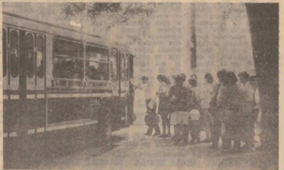
Un pas spre civilizație.

Cursurile incluse în această listă au la bază cotații ale societăților bancare autorizate să efectueze operațiunile pe piața valutară. Prezența listă nu implică obligativitatea utilizării cursurilor în tranzacții efective de schimb valutar și înregistrări