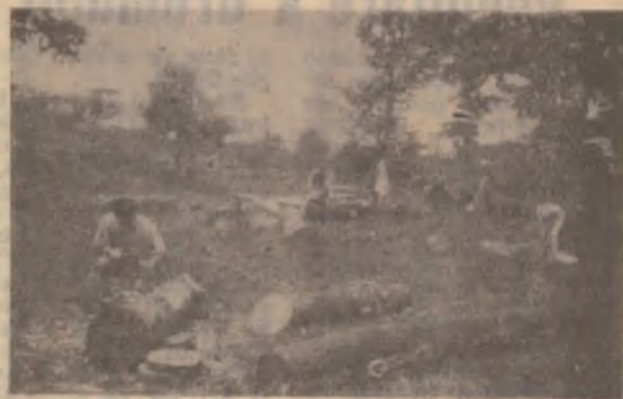
Sculptura în lemn face parte din programul de practică al studenților.