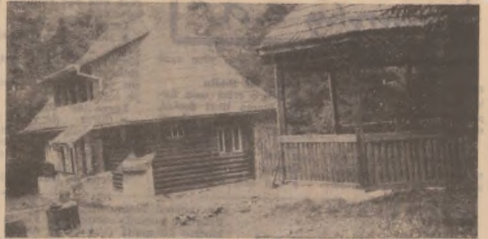
Amenajări turistice în Munții Retezat, la Rotunda.

cum se spune în scrisoare, rezultă cu claritate că s-a procedat corect din partea comisiei locale pentru stabilirea dreptului de proprietate asupra pământului. Iată, deci, o precizare necesară menită să clarifice unele suspiciuni. (Nicolae Târcob)