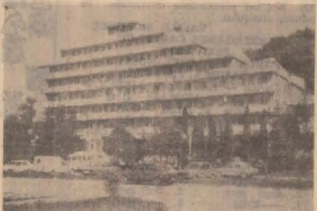
Geoagiu Băi — Complexul „Aurel Vlaicu“.

și pentru liniștea și calitatea serviciilor oferite. (C.P.)