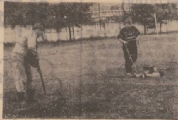
La Jiul se lucrează la cosirea ierblilor și pe terenurile de antrenament.

Problema care se pune însă va putea oare clubul Jiul să mențină mai departe centrul de pregătire a copiilor și juniorilor? E o întrebare la care trebuie să se dea răspuns în această perioadă de către sponsorul Jiului RAH Petroșani și Liga sindicatelor miniere.