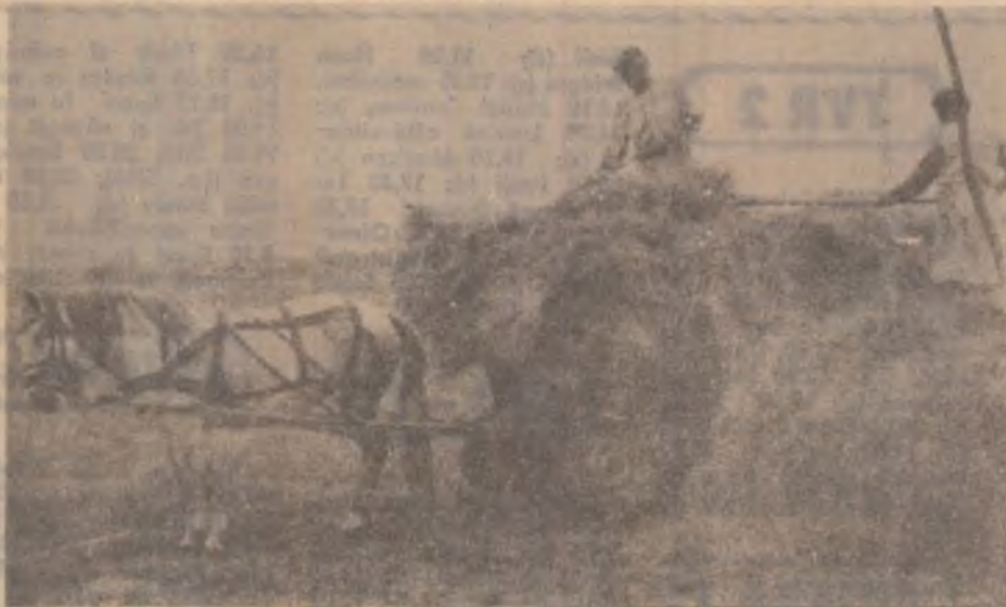
E vremea strânsului fanului (la Reea). Numai de ne ar lăsa ploile astea...

Arh. ION CONSTANTINESCU, Arhitect șef al județului Hunedoara