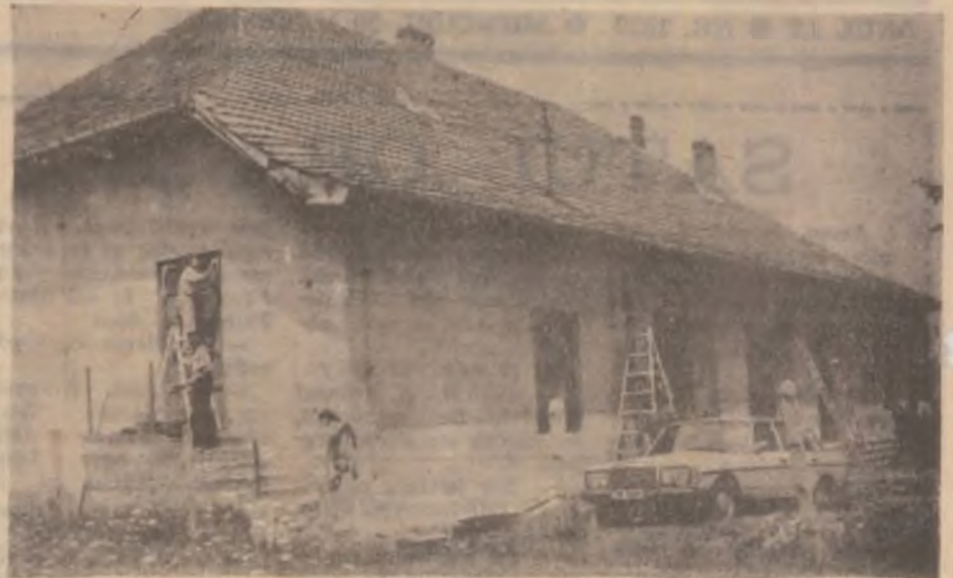
Căminul cultural din Totești se află în reparație capitală. Până la 1 august va fi gata.

Fără 1100 lei/kg nu-i dăm. La munca grea și la banii pușini ai țăranelor, nimeni nu se gândește. Așa să scrieți la ziar. Ia uitați-vă! Grâu ca aurul de frumos și de curat. Și cât scoateți la hectar? N-am idee. Abia am început. În orice caz peste 4500 de kilograme. Dar nu-l dăm pe doi bani cât ne plătește statul. Dacă nici la pâinea țării nu putem nici cheltuielile.