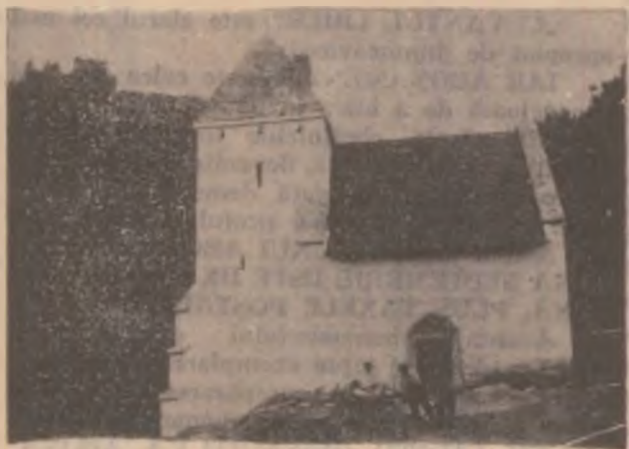
SCHITUL COLȚ. În spate (stânga sus) se ză- rește Cetatea Colț.