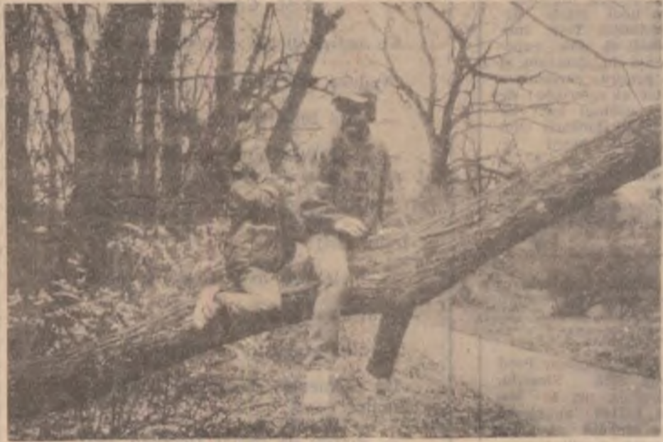
Parcul din Simeria, o zi de vacanță.

potrivit legii, soțul decedat“. De asemenea, la Capitolul II, art. 15, litera e), textul legii stipulează următoarele: „scutirea de impozite a indemnizațiilor și a rentei lunare, acordate potrivit prezentei legi, de impozitul pe salarii și de impozitul pe clădiri pe terenurile din municipii, orașe și comune și pe alte venituri, cu excepția celor provenite din activități comerciale. Aceste scutiri se aplică și văduvelor necăsătorite ale veteranilor de război“.