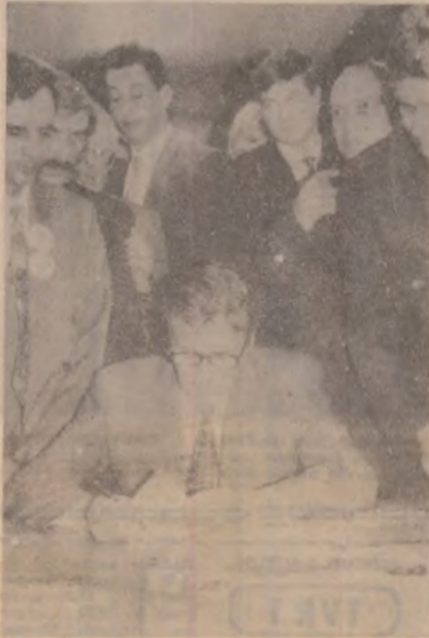
Președintele României, Emil Constantinescu, dă autografe pe cartea — document „După 20 de ani sau Lupeni '77 — Lupeni '97”, realizată de ziarștii de la „Matinal” Petroșani.