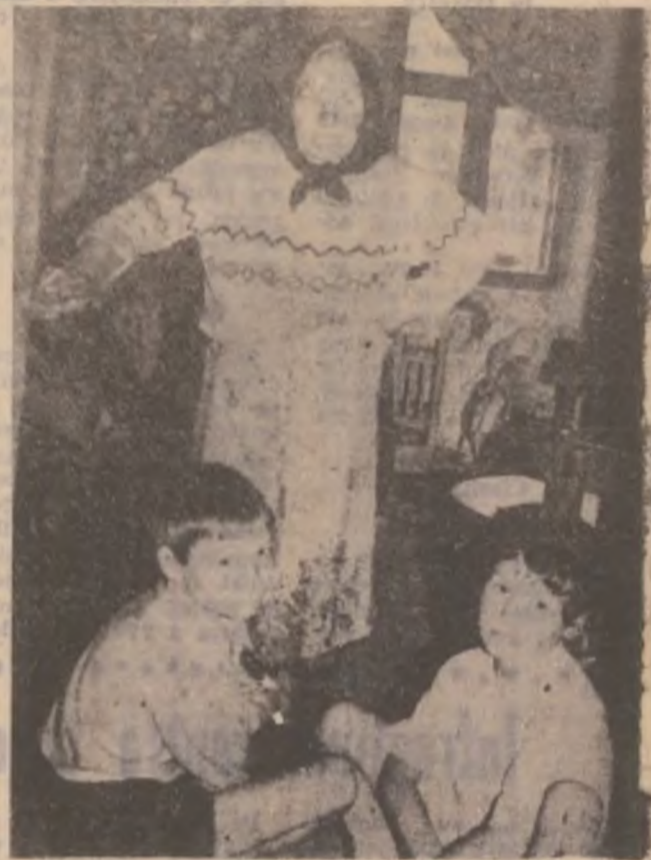
Dragi imi sunt copiii ăștia! Da, de ce-or fi așa de năzdrăvani?